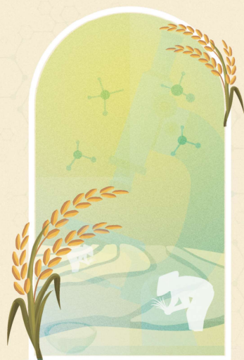
稻米品質提升與水稻多元利用研討會