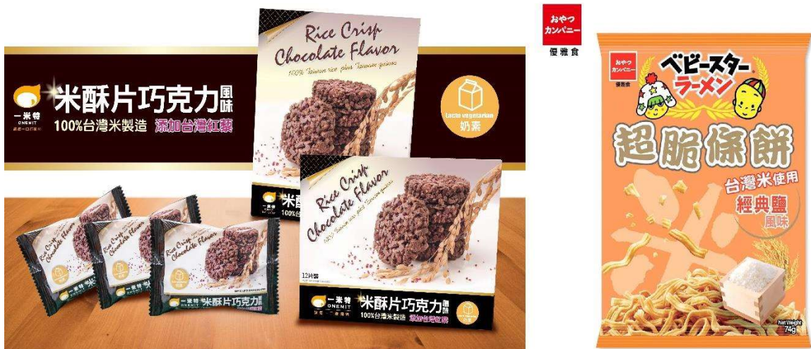
圖 6. 米製休閒點心 (左：一米特-米酥片巧克力風味；右：優雅食超脆條餅)