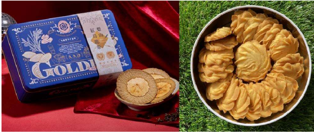
圖 5. 米製伴手禮 (左：久久津食品-紅鳥龍蘋果米餅；右：力凡烘焙坊-米的曲奇餅)