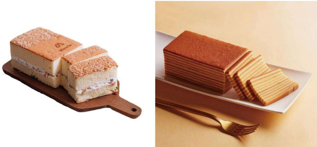
圖 3. 使用 100%米穀粉可製成組織柔軟的米蛋糕 (左：米樂客-鳴賞鹹蛋糕；右：禮坊-皇家牛奶米千層蛋糕)