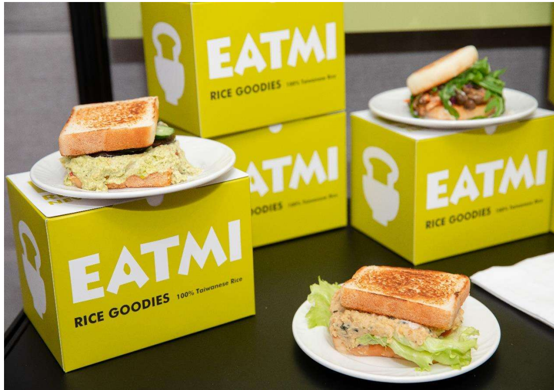
圖 2. 含米量 100%之米吐司與雲端廚房與 Just Kitchen 雲端廚房聯名商品