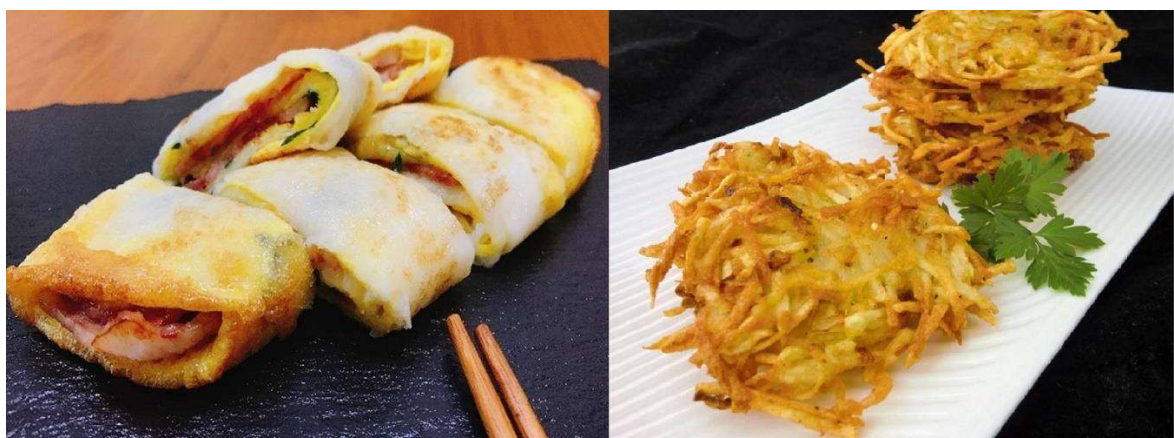
圖 8. 米穀粉於居家烹飪之應用 (左：米漿蛋餅；右：馬鈴薯米煎餅)