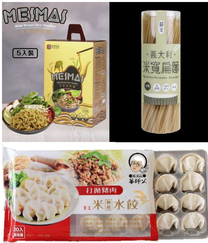
圖 4. 米麵食產品 (上左：源順食品-沒麥乾拌麵；上右：銀川有機農-義大利米寬扁麵；下：奇巧食品-打拋豬肉米麵皮水餃)