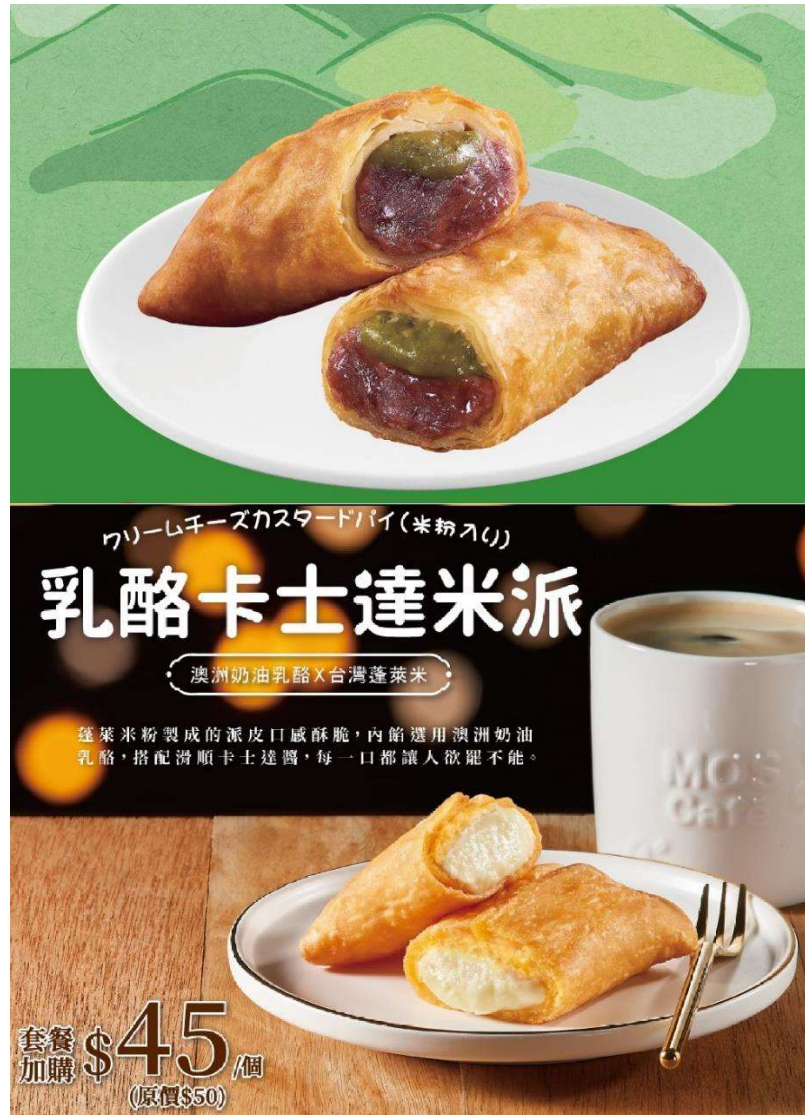
圖 7. 米製油炸類點心 (上：抹茶紅豆米派；下：乳酪卡士達米派)