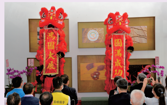
祥獅獻瑞祝本場鴻圖大展

在此次改制中本場原「生物防治分場」提升為「生物防治研究中心」，為農業部唯一之生物防治專責單位，突顯了其在全國「以菌制菌」、「以蟲剋蟲」研發業務上的重要性與主導性。最後呂場長現場宣告本場組織發展願景由「守護者」升格為「領航者」，並懇請在場來賓們繼續的支持與鼓勵，大家肩並肩共同努力，為臺灣農業更好而打拼！