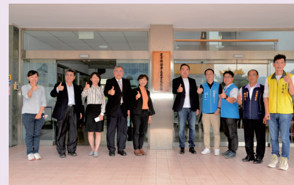
長官與貴賓合影，期許未來大家繼續肩並肩共同努力，全力為臺灣農業打拼