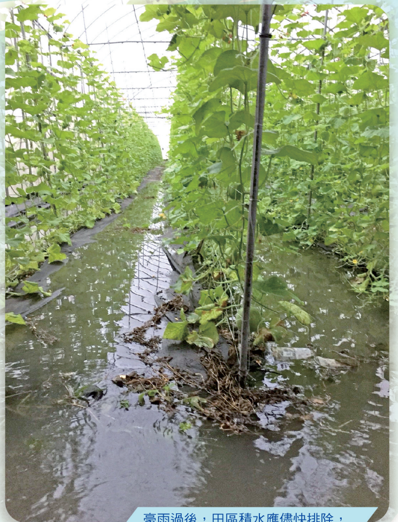
豪雨過後，田區積水應儘快排除，避免根部受損，亦可減少病菌危害。