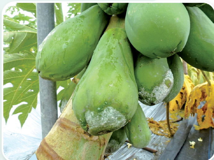
積水園區容易發生疫病，常由木瓜果實接近地面處開始發生。