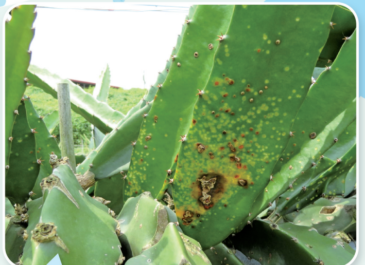
雨後紅龍果易發生潰瘍病