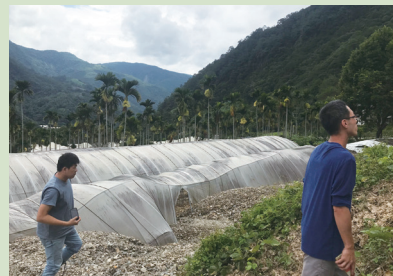
▲ 卡努颱風及西南氣流帶來的強降雨，引發土石流，番茄設施遭埋沒