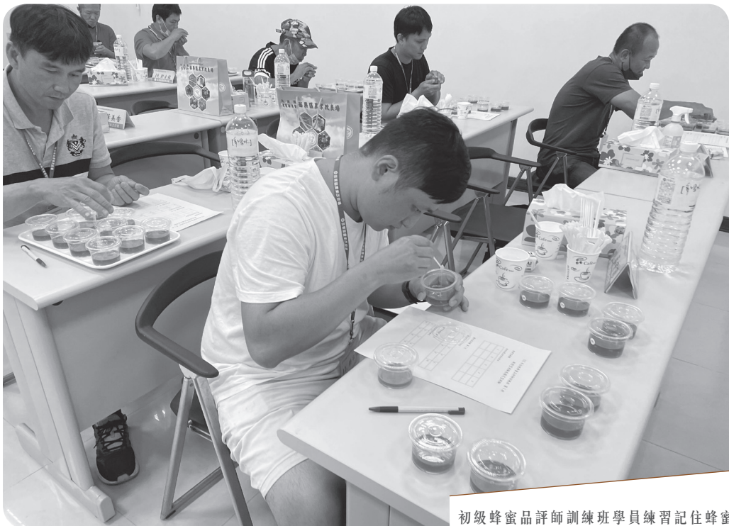
初級蜂蜜品評師訓練班學員練習記住蜂蜜風味。