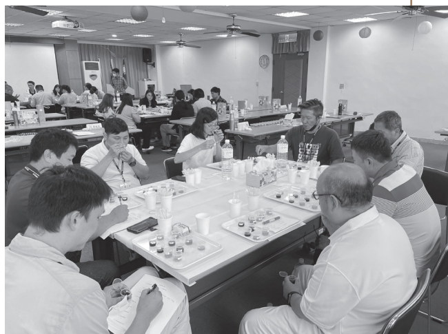
初級蜂蜜品評師分組品嚐多樣特色蜂蜜。

國產蜂蜜評鑑規則分為初評（儀器檢驗）及複評（感官品評）兩階段，初評又細分為一般品質標準檢驗及藥物殘留檢驗（抗生素及農藥）2類，一般品質標準參照蜂蜜國家標準CNS1305，檢驗水分、蔗糖、總糖（果糖及葡萄糖）、水不溶物、酸度、