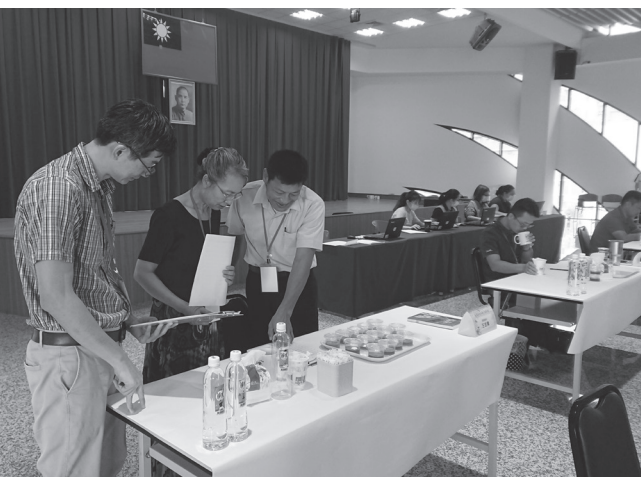
新加入蜂蜜評鑑的蜂蜜品評師和專家前輩交流經驗。

官能品評是一門用以引發、量測、分析、解釋食物或其他材料特性，受五感（視、嗅、嚐、觸、聽）覺知後反應的科學，依據品評目的類別，又可分為消費者型及試驗分析型兩大類，因此品評員也分為兩大類。消費者品評員：未受過訓練，通常用於產品開發或是產品行銷，品評會受個人主觀感受影響，建議人數較多，以50~200人較佳；試驗分析型品評員：對品評方法有經驗或是受過訓練者，會依照經驗及品評能力客觀分析樣品，每次品評所需人數較少，最多不超過20人。國內蜂蜜評鑑是採用試驗分析型的品評員，即專家型的品評員，對於參評蜂蜜樣品相當熟悉，能分辨蜂蜜本身品質優劣及是否混雜其他蜂蜜，這類型品評員則需要透過事前的訓練與累積經驗才能執行蜂蜜品評工作。