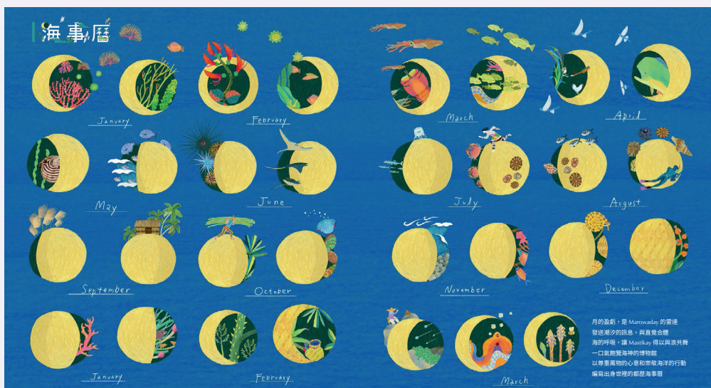
■ 都歷部落的海事曆，記載前人順應自然過日的生活智慧。

記錄都歷部落年度重要行事的海事曆，也完整收錄在《都歷的海事》中。跟隨前人順應四季流轉生活的時節提要，依曆排程。1月採青苔與海藻、迎向狩獵季的2月，也準備開始農務。3月抓蝦，6月割稻，8月男子成年歌舞祭，12月祭祖。