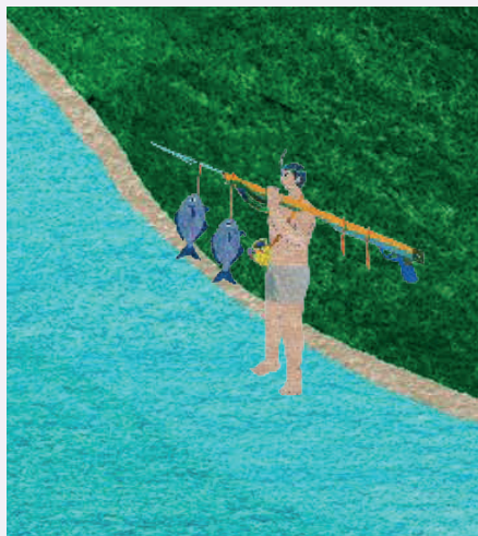
■ 介紹各地域的族語，也深入介紹命名緣由。

另外還有 Calacahay（會呼吸的海），提醒水下的獵人聆聽海浪的聲音；南北族人交換訊息、交易貨物的 Kalalayap（交流之地）；海岸線上自然淡水噴湧處被稱為 Cinemnemay（湧泉）等，從前人取名的智慧，得以完整理解都歷族人與自然共生的模式。