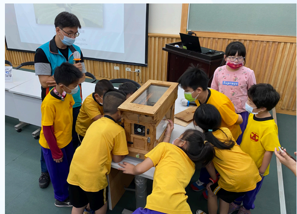
▲環境教育室內課程中，學員與講師互動熱列