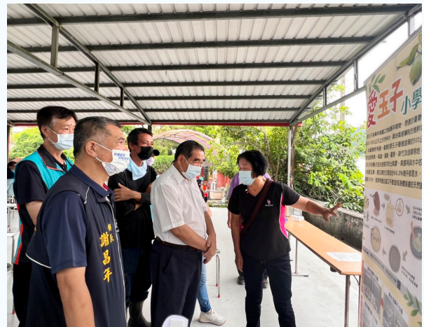
▲參與「銅鑼鄉新盛社區仙草節」活動