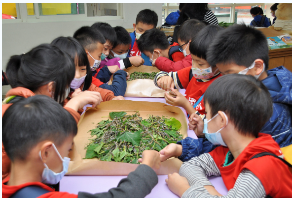
▲小朋友近距離觀察體驗蠶寶寶飼育

為瞭解遊客對臺灣蠶蜂昆蟲教育園區及環境教育課程服務滿意度與學習成效評估，採用量化學習回饋單分析之問卷設計。調查核定環境教育課程方案 2 種，「Silk 路之旅」教案問卷發放數為 143 份，回收 143 份，回收率為 100%，「The Silence of the Bees」教案問卷發放 135 份，回收 130 份，回收率為 97.7%。問卷調查含 5 個評量項目（課程內容豐富度、園區服務水準、講師授課專業度、推薦親友參訪），在「Silk 路之旅」教案加權平均數分別為：4.76、4.81、4.92 及 4.77，而「The Silence of the Bees」教案加權平均數分別為 4.77、4.82、4.95 及 4.76，顯示學員認為對環境教育課程獲益頗多，對服務人員、講師助教熱誠專業度滿意，願意推薦親友再次蒞臨本園區。另分析環境教育課程「Silk 路之旅」及「The Silence of the Bees」2 個教案，學員最喜歡的課程內容，結果皆為「展館導覽解說課程」，其中「Silk 路之旅」教案為展覽館導覽解說（88%）、室內課程（77%）、DIY 製作（68%），「The Silence of the Bees」教案為展覽館導覽解說（98%）、室內課程（87%）、DIY 製作（77%），不論是「Silk 路之旅」或「The Silence of the Bees」，在完成 4 小時環教課程後，90% 以上學員認為環教課程感到滿意且有趣的。