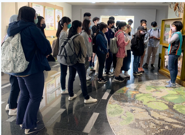
▲解說人員向參與民眾解說蝴蝶生態