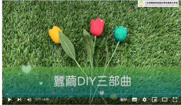
▲環境教育相關課程影片 (左：臺灣人必修課 - 愛玉子，右：蠶繭 DIY 三部曲)