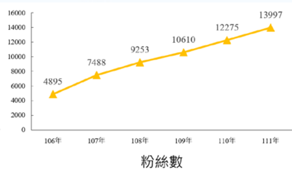
▲本場 Facebook 粉絲數成長情形