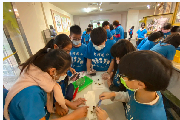
▲螢火蟲飼育活動學員彼此討論