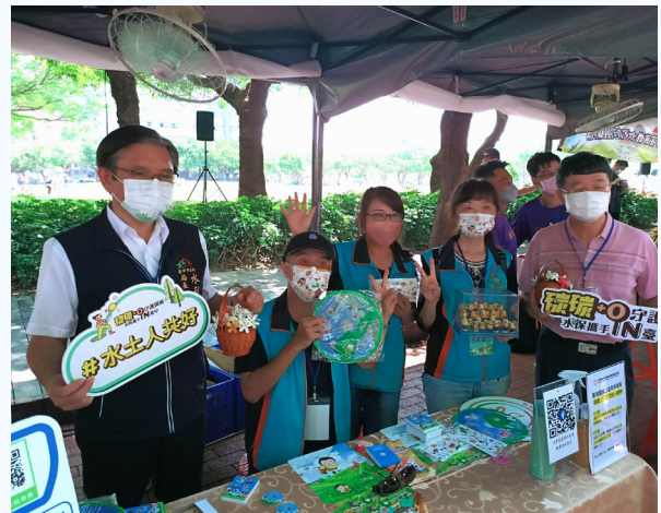
▲參與「碳碳 +0 守護環境水保攜手 in 臺中」環教活動