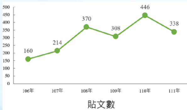
▲本場 Facebook 貼文數統計