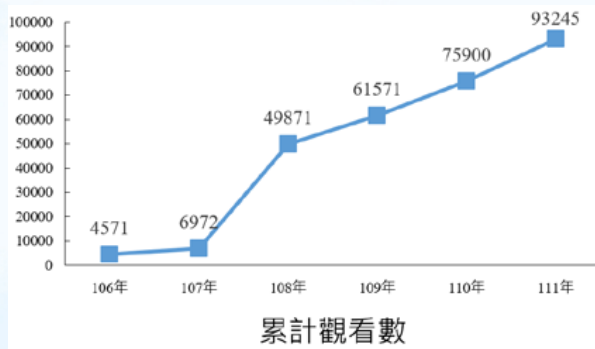
▲本場 YouTube 頻道累計觀看數統計