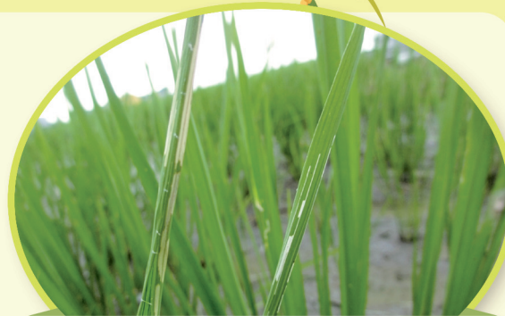
瘤野螟(縱捲葉蟲)危害狀