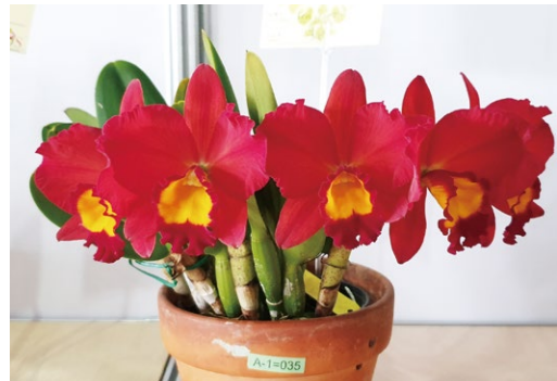
圖十二、近年來，植株短小之品種越來越受消費者喜愛，如圖之 Rth. Smiley Kiss

原產於中美洲墨西哥、委內瑞拉、哥倫比亞等國，本屬原歸於嘉德麗雅蘭屬，2003年由學者依據DNA分析證據而獨立出，包含 Gur. aurantiaca (圖九)、 Gur. bowringiana 等，亦是重要育種親本。