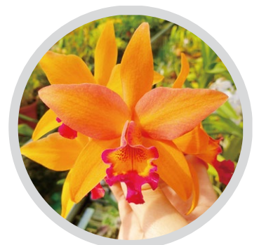
圖八、 Rechingera Ancep Passion ，遺傳了蕾莉亞蘭雅緻的星狀花貌