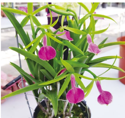
圖六、本株 Brassocattleya Gulfshore's Beauty 為嘉德麗雅蘭屬與白拉索蘭屬之雜交後代，由圖可見白拉索蘭的棒狀葉特徵，在後代表現依然顯眼

原產於中美洲墨西哥、瓜地馬拉、貝里斯、宏都拉斯等國，本屬特色為花梗極長，最常見的如 L. anceps 、 L. rubescens (圖七)，花瓣較窄，花朵呈現雅緻的星狀，植株耐候強健，育種後代繁多(圖八)。