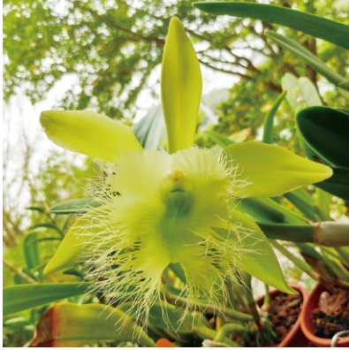
圖三、俗稱「豬哥」的 Rl. digbyana 唇瓣為誇張的鬚毛狀，花朵並帶有檸檬清香，育種後代繁多