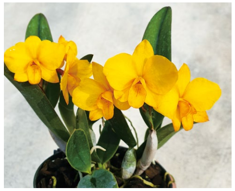
圖二、小型嘉德麗雅蘭 Cattlianthe Faikon Ball 因血統含有原先歸類於索芙蘭屬的 C. cernua ，成功育出小巧可愛的株型