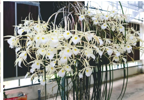
圖五、另一種白拉索蘭 B. flagellaris ，也是帶有棒狀葉