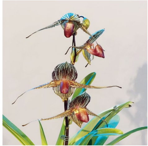
圖十七、俗稱「肉絲」的 Paph. rothschildianum 花朵開展可達20餘公分，為仙履蘭之王