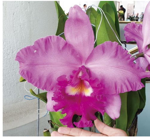
圖十一、臺灣早期即開始流行的嘉德麗雅蘭品種，幾乎都是如圖一般的鮮豔紫紅大花，圖為 Rlc. Taichung Beauty