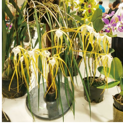
圖四、白拉索蘭屬 Brassavola 特徵為棒狀葉，圖為「煙火」白拉索 B. cucullata ，盛開時宛若空中煙火綻放般耀眼