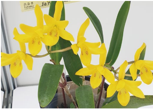
圖九、圈聚蘭屬之重要原生種 Guarianthe aurantiaca