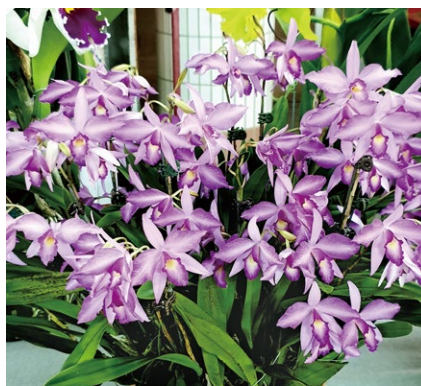
圖七、蕾莉亞蘭屬花瓣較尖，整朵呈現星狀，圖為 Laelia rubescens