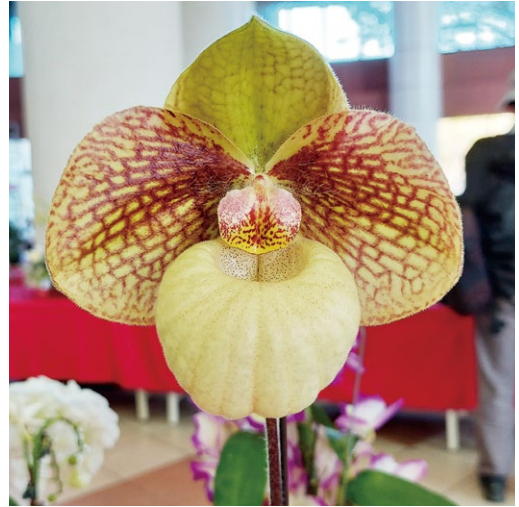
圖十四、仙履蘭花朵正中央具有一個明顯的盾狀假雄蕊，下方唇瓣特化為囊袋狀

臺灣各類蘭展及花市上所見，絕大多數為巴菲爾鞋蘭屬，例如赫赫有名的「金童」 Paph. armeniacum 、「玉女」 Paph. micranthum (圖十五-A~B)等，特色是渾圓的袋瓣及鮮明的色彩，令人愛不釋手！其育種後代許多也繼承其花形、花色之特點，如 Paph. Wössner China Moon 融合 Paph. armeniacum 金黃色及 Paph. hangianum 寬大的花瓣； Paph. Magic Lantern 則帶有 Paph. micranthum 的粉紅色(圖十六-A~B)。有「仙履蘭王者」之稱的 Paph. rothschildianum (俗稱肉絲)特色是碩大花朵，上萼瓣既圓又寬，宛如一片蒲葵扇，側瓣開展可達20餘公分，氣勢磅礴(圖十七)，是蘭展常勝軍！