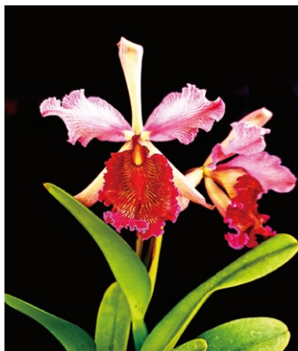
圖一、 Cattleya dowiana var. rosita 具有亮眼華麗的波浪唇瓣，是典型的嘉德麗雅蘭

原產於中南美洲巴西、委內瑞拉、哥倫比亞、厄瓜多、祕魯等國，包含最典型的大花、香花或波浪唇瓣，如 C. lueddemanniana 、 C. mossiae 、 C. dowiana 等，以及耳熟能詳的「走路人」 C. walkerana 、 C. nobilior 亦是芳香撲鼻。此外，本屬經2009年英國皇家園藝學會 (RHS) 決議，現也囊括原稱為索芙蘭屬 Sophranitis 、巴西產的蕾莉亞屬 Laelia 的物種，這類群很多