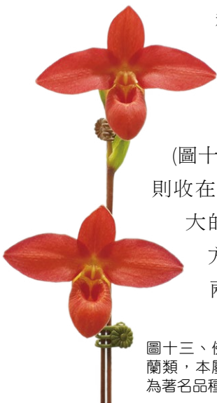
圖十三、佛拉密鞋蘭屬也歸類於仙履蘭類，本屬多帶有艷紅、橘色調，圖為著名品種 Phragmipedium Jason Fisher

主要特徵：仙履蘭之花朵唇瓣特化成囊袋狀，如拖鞋一般，此唇瓣特稱為「袋瓣」是其辨別重點，其為蘭科植物中演化較為原始的一群，花朵中央具有一個明顯的盾狀假雄蕊(staminode)(圖十四)，兩個可孕性的雄蕊則收在其後，仙履蘭只有一枚大的下萼瓣，位於袋瓣後方，與其他蘭花有左、右兩枚下萼瓣不同。