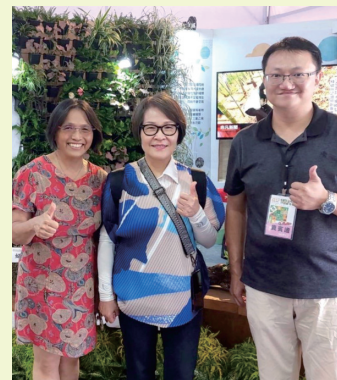
苗栗縣政府鄧桂菊副縣長(中)蒞館參觀指教