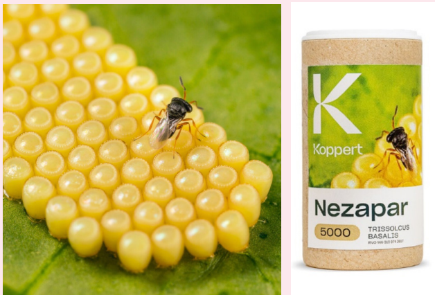
圖一、Koppert 防推出治南方綠椿象之寄生蜂商品「Nezapar」。

「Nezapar」的卵寄生蜂 ( Trissolcus basalis ) 商品 (圖一)，Koppert 亦有諮詢人員或經認證之經銷商，依據農民的作物種類、氣候條件，提供商品釋放之建議服務。