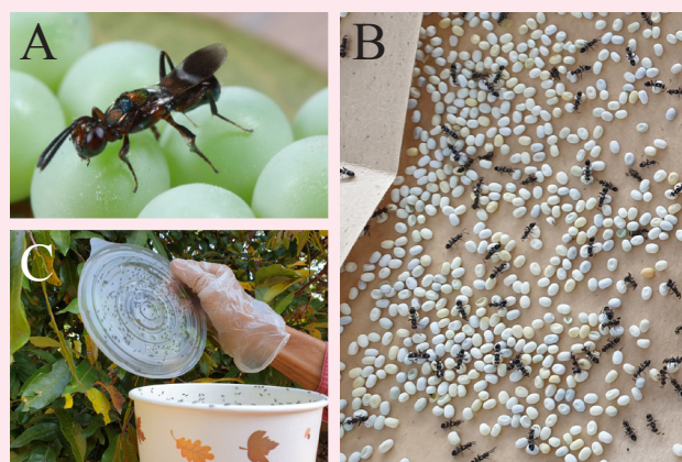
圖三、(A) 平腹小蜂、(B) 替代寄主蓖麻蠶卵及 (C) 釋放盒。

寄主，供雌蜂產卵寄生，可短時間內大量繁殖平腹小蜂。田間釋放方式以成蜂釋放為主，並開發盒裝及改良型釋放盒 (圖三)。本場每年 2~6 月受理荔枝與龍眼農友申請平腹小蜂，農友於第一隻小蜂羽化 4~5 日後便釋放寄生蜂，10~14 天釋放一次，連續釋放 4 次，寄生率可達 70~80%。建議釋放數量以每公頃釋放 1.4 萬隻以上較佳。