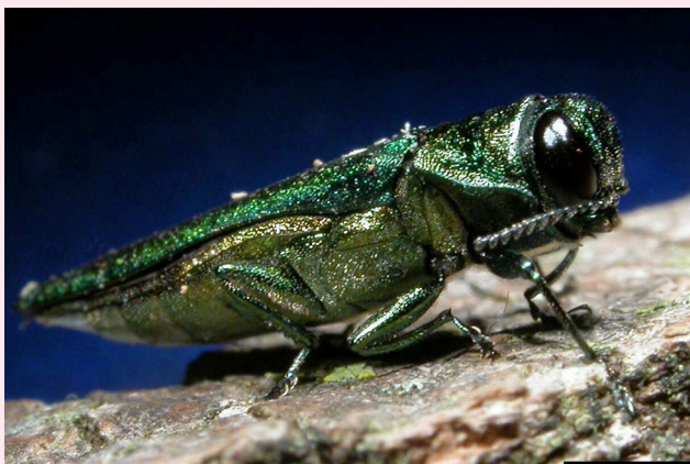
圖二、光臘吉丁蟲成蟲。。

近期亦有運用寄生蜂防治林木入侵種害蟲的實例。光臘吉丁蟲 ( Agrilus planipennis Fairmaire) (簡稱：EBA)(圖二)的寄主為木犀科 (Oleaceae) 栲樹 (在臺灣的特有種又稱光臘樹)，於 2002 年首次入侵北美後大規模擴散，曾導致美國及歐洲栲樹發生大量死亡案例。光臘吉丁蟲生活史長達 1 至 2 年，多數時間均躲藏於樹木韌皮危害，故難以追蹤及根除，加上藥劑防治成本高昂，自 2012 年起，