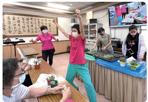
資深美女高興著被抽中選禮物