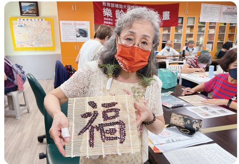
83歲罹患類風濕關節炎的資深美女展示她完成的成品

日間關懷據點的90歲資深美女，她跟著同學在本場研究人員及志工的指導下，每次都能自己完成作品並跟同學分享。讓筆者不禁想，我90歲時也能這樣自如嗎？每次活動最後總會來個