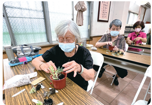
90歲資深美女穩妥的種著香草植物