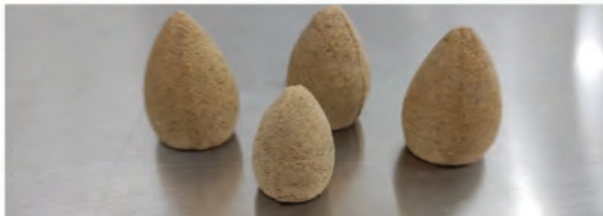
黃荊驅蚊香椎產品DIY製作流程