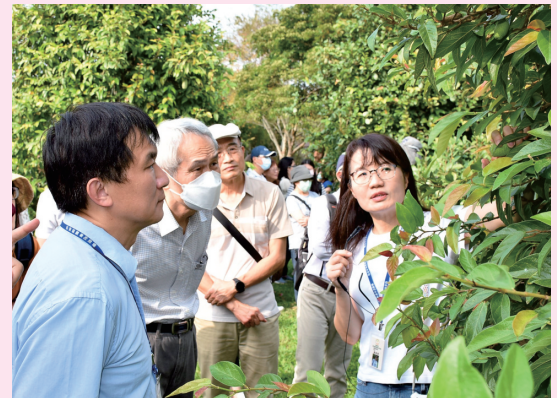
考試院周弘憲副院長(左2)仔細聆聽愛玉子生態解說