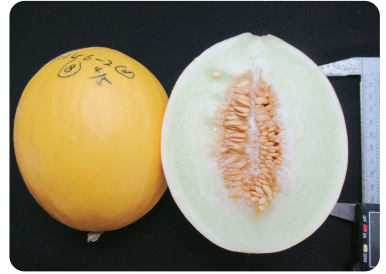
圖5. 光皮甜瓜果實達採收適期

為使澎湖地區農友有更多甜瓜種類的選擇，本文介紹光皮甜瓜的離地栽培技術，利用直立式栽培的方式種植光皮甜瓜，每株只留1果，再加上良好的水分、肥培及病蟲害管理等，即可種出果型飽滿、甜度高、單果重佳的光皮甜瓜。