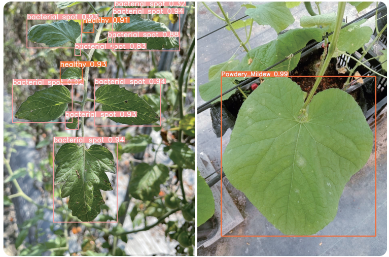
圖2. 以YOLO演算法在小番茄(左)及小胡瓜(右)葉片上進行病害影像自動辨識訓練。

在應用技術研發的部分，本場自109年度起，於番茄及小胡瓜溫室架設4K網路攝影機(圖1)，即時監測作物病害發展現況，並定時擷取影像資料透過無線網路儲存並供人工智能進行病害辨識訓練，嘗試透過YOLO演算法建立番茄與小胡瓜病害影像辨識模式。初步研究結果顯示，以YOLO演算法(YOLOv5)在小番茄及小胡瓜葉片上，分別進行茄科細菌性斑點病及瓜類白粉病的病害影像自動辨識訓練(圖2)，均能獲得良好的辨識率，未來將持續改善演算法及增加訓練用圖像資料，期能大幅度提高辨識速度，同時保持較佳的準確性。此外，為了未來能讓農友便利