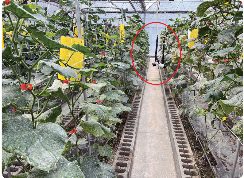
圖1. 於小胡瓜監測場域架設4K網路攝影機

遠端影像監測系統於植物病害監測的應用，實現了自動化、即時且連續監測的目的，且能夠在病害發生初期及擴散蔓延之前提供即時的預警，有助於農友及早採取防治措施，提高防治成效。而透過先進的影像處理和人工智能學習，遠端影像監測系統能夠將大量的即時影像數據轉化為有價值的訊息，用來準確地檢測和辨識植物病害，幫助農友確認病害的種類、嚴重程度及疫情情況。透過遠端影像監測系統的應用，農友不再需要投入大量的監測人力，在農業缺工，勞力嚴重不足的現代，節省了農友大量的時間和人力，同時也可減少因人為因素導致的誤判和疏漏。此外，還可節省病害檢測和監測所需的設備和材料成本以及長時間巡視田區所需的交通費用。