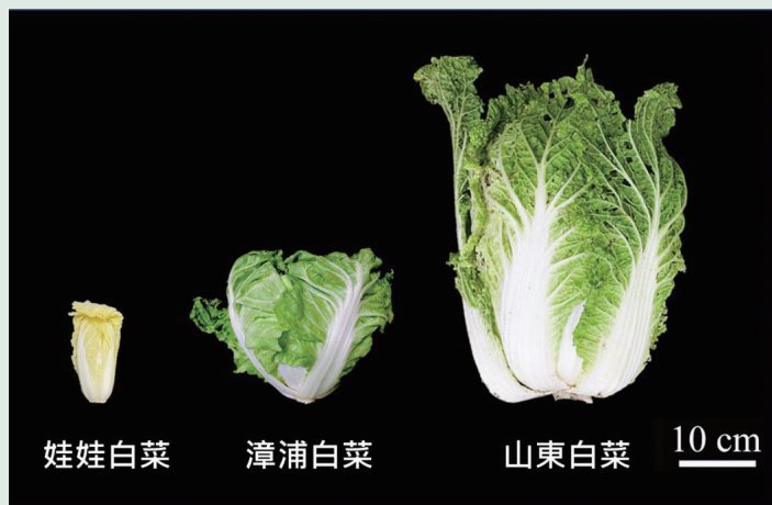
▲國內常見的 3 種結球白菜

臺灣全年皆有結球白菜生產，然其性喜冷涼，夏季種植時因高溫影響，多數品種無法正常結球，或結球後有頂燒或爛心之問題，在品種選擇上有所侷限，因此夏季國內結球白菜產量較低，價格亦高。為解決此問題，本場近年來努力針對具耐熱、早生特性之漳浦白菜進行品種選育，期望選育出可於夏季順利結球，單球重 600 公克以上，且無頂燒或爛心之漳浦白菜品種供產業使用。目前正值國內結球白菜的盛產季節，品質優良且價格便宜。鼓勵大家把握時間，多多消費健康、安全又美味的國產結球白菜。