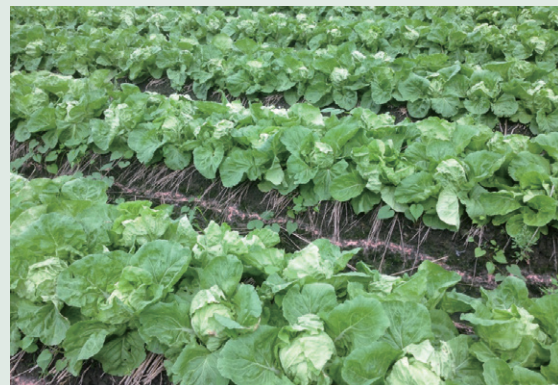
▲漳浦白菜生產田區

白菜滷；山東白菜及娃娃白菜適合於每年 10 月至翌年 3 月種植，此時期亦為國內結球白菜的盛產期。山東白菜為晚生種類，種植後約 95-100 天採收，球重可達 1-5 公斤，體積為結球白菜中最大。其纖維粗，適合久煮或加工醃漬泡菜。常見品種有‘春秋 54’、‘上將白菜’、‘黃美人白菜’。娃娃白菜為最迷你的結球白菜，體積僅山東白菜 1/6，種植後約 40-50 天採收，球重約 0.4-0.6 公斤，常見品種有‘金娃娃白菜’、‘金橘娃娃菜’、‘迷你娃娃菜’。其內葉呈淡黃色，味道清甜、適口性佳，適合清炒或蒸煮。結球白菜除富含水分及膳食纖維，亦含許多人體所需的營養元素，如鉀、鈣、