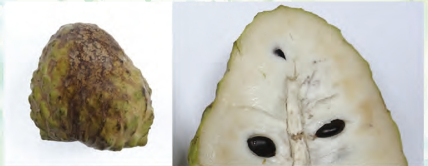
鳳梨釋迦果實貯藏於3℃下7天果實即會出現寒害徵狀，果皮出現褐化斑點，取出置於25℃下軟熟，褐化會更嚴重(左)，果肉會有部分硬塊及褐色斑點(右)。

鳳梨釋迦冷鏈貯運溫度建議為7℃-9℃，但不宜超過7-10天，因溫度太低或低溫貯藏過久仍會造成果寒害，致使果皮褐化，後熟後果肉也容易褐化且產生異味。因此鳳梨釋迦果實採收後，建議要快速運送到市場或消費者手上，並與物流業者密切配合，如以低溫冷藏運送，溫度不宜過低且時間越短越好，以確保品質。