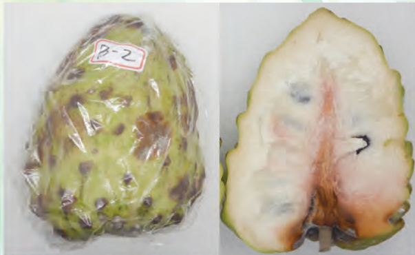
包保鮮膜的鳳梨釋迦軟熟後表皮褐化(左)及嚴重者果肉有紅色斑塊(右)、異味等異常情形。

鳳梨釋迦雖較釋迦耐貯運，但仍屬於低溫敏感性水果，果實不宜低溫長期貯藏。另外，因鳳梨釋迦果實呼吸率高，未軟熟前不可以用塑膠袋或保鮮膜密封包裝，以免因