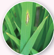
水稻葉稻熱病病斑