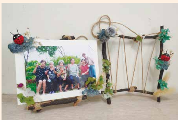
成品示意圖