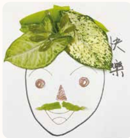
完成作品之示意圖