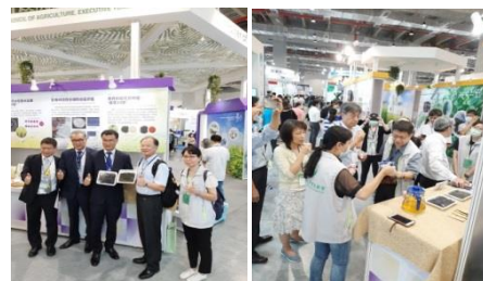
圖4、山蘊於南港展覽館醫療科技展展示推廣。