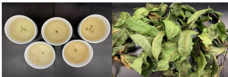
圖3、成熟葉製茶技術所製成特殊風味茶滋味甘甜，茶湯色澤明亮。

品種命名後將臺茶24號扦插繁殖技術授權給5家種苗商推廣種植，除了適製紅茶及綠茶外，本場也致力於加工技術研究，包括開發「臺灣原生山茶永康變種成熟葉製茶技術」，使得採摘時間不再受限於新芽生長季節，並可降低咖啡因含量，且首次於「2021臺灣醫療科技展-農業健康館」參展。在111年本場進一步優化了烏龍茶製程，製作出了清香型山蘊烏龍茶，其滋味甘醇，不苦不澀，且咖啡因含量較低，與國內其他市售的烏龍茶有所不同，並已公告技術移轉。