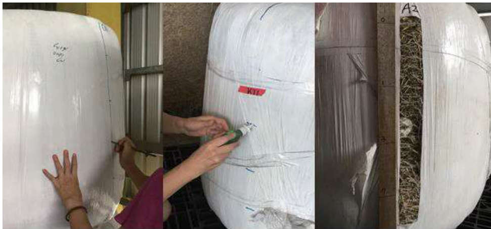
圖 1. 半乾青貯膠膜包的破損改善試驗。左：草包戳洞（ < 2 mm），中：藥劑處理與封孔，右：開封調查損壞比例。 Fig. 1. The damage improvement experiment of pangola grass haylage. Left: poking small holes ( < 2 mm) on haylage surface, Middle: reagent treatment and sealing, Right: investigation of damage situation.

III. 統計分析：試驗結果以 SAS 軟體（2002）之 GLM procedure 進行變方分析，主效因子為藥劑處理（Chemical）、封孔時間（Seal）及貯存時間（Storage），各主效應均為固定型，各處理平均值再以鄧肯氏多變域測驗（Duncan's Multiple Range Test）進行檢定，比較各處理平均值之間是否達差異顯著。