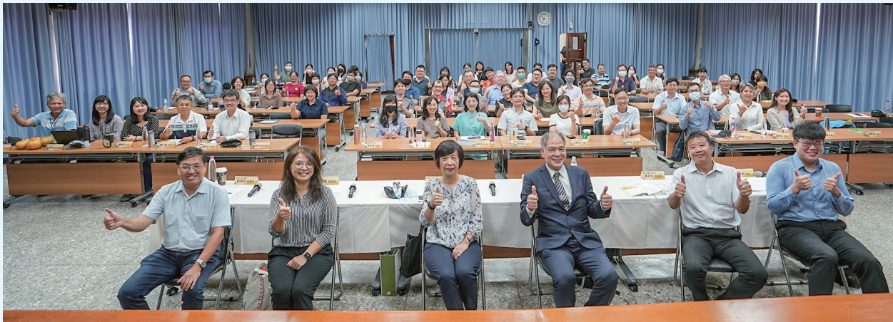
▲ 交流活動來賓大合照