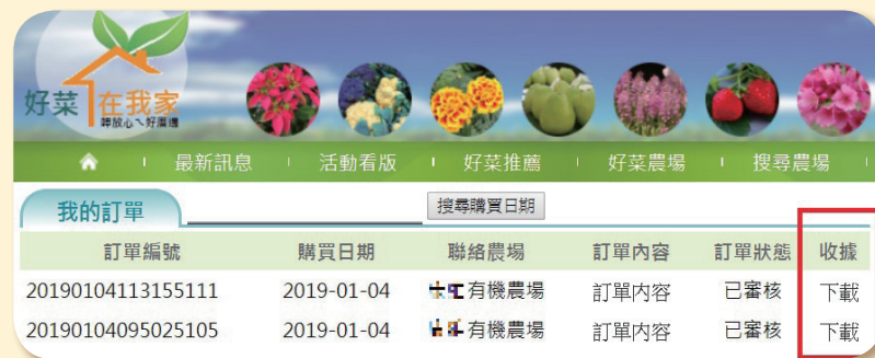
本場貼心為農友設計無紙化的農民收據，環保又便利。