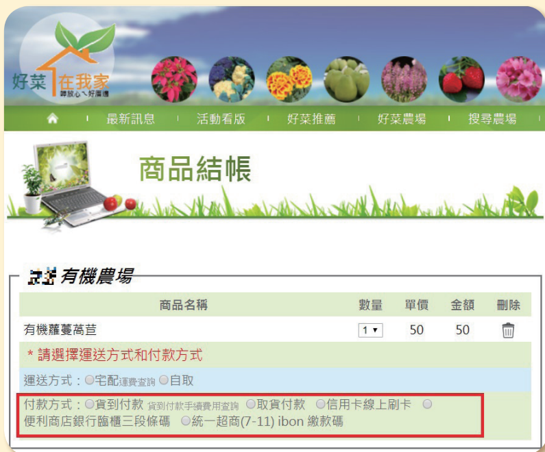
為消費者自好菜農場購買農產品線上多元支付功能與選擇付款方式界面。

這樣的多元支付服務機制，使農友於生產端不僅可以確保訂單來源作計畫生產、秩序供貨；在銷售管理端更可以培養農民認識消費者的需求，進而培養與客戶直銷通路，加上種植中的蔬果新鮮看的見，提升了售前服務新觀念。本場日後持續規劃加入更多管道支付方式，以提供農友與消費者更豐富及便利的使用體驗，有興趣的農友及消費者請趕快申請加入，體驗線上支付樂趣。