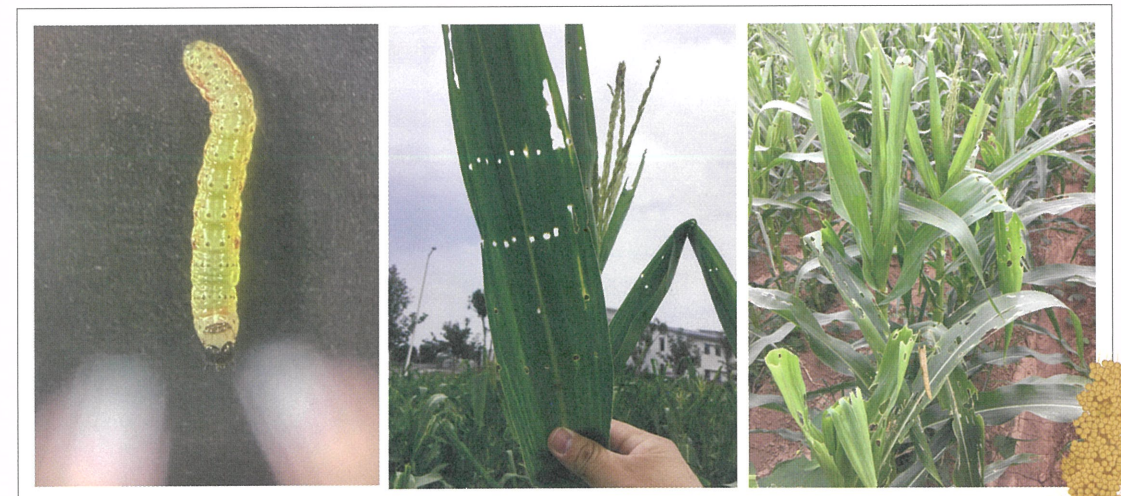
圖2. 秋行軍蟲幼蟲（左）在高粱葉片上造成的食痕（中），其危害程度已嚴重影響高粱栽培（右）。