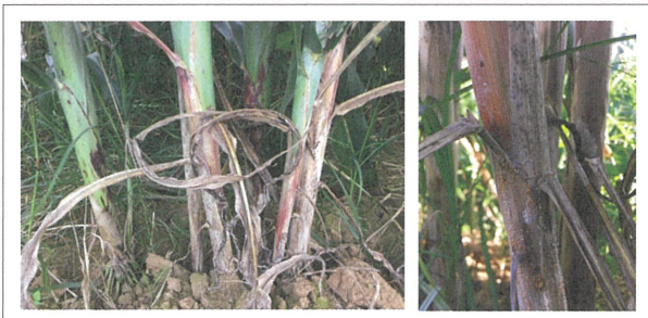
圖5. 高粱莖部上的紋枯病徵(左),後期菌絲會特化成為菌核(右)。

面積增加,也陸續觀察到其他病害的跡象,較為普遍的是由包含 Bipolaris sorghicola 、 Phoma sorghina 等多種不同病原真菌引起、常稱為葉枯病或葉斑病的地上部病害(圖4),嚴重時會影響植物光合作用、導致生長衰弱,病斑上的孢子還會藉由風及雨水傳播於田間造成流行。紋枯病(圖5)則是由存活於土壤中的病原真菌 Rhizoctonia solani 感染造成,病原菌自土壤表面侵入莖基部後漸次而上,最終導致高粱全株枯死,病原菌產生的菌核再掉入土中,成為下個栽培期的田間感染源。高粱出穗後還要面對 Fusarium spp. 或 Curvularia spp. 引起的穗腐病(圖6)發生的風險,穗腐病除影響產量外,病原菌產生的毒素還會影響高粱加工品的品質與風味,甚至對動物或人體健康造成危害。