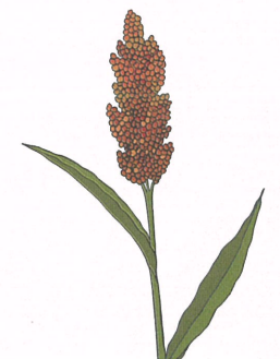
圖6. 由多種病原菌個別或複合感染造成的穗腐病。