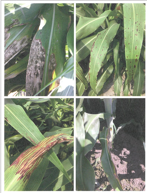
圖4. 高粱葉片上由不同病原菌感染造成的葉枯與葉斑病徵。