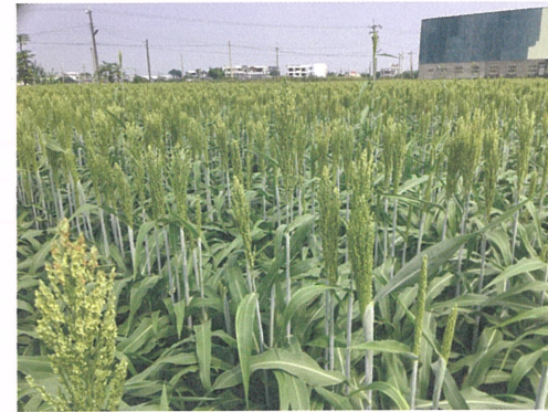
圖1. 雲林土庫111年春作期間之轉作高粱田區。

行政院農業委員會（簡稱農委會）在糧食安全、水資源運用等綜合因素考量下，全面推動「稻田大區輪作轉作措施」鼓勵農民轉作硬質玉米、大豆及釀酒高粱等具節水效益的雜糧作物。其中，高粱栽培（圖1）的推廣工作上，過去2年內在雲林、