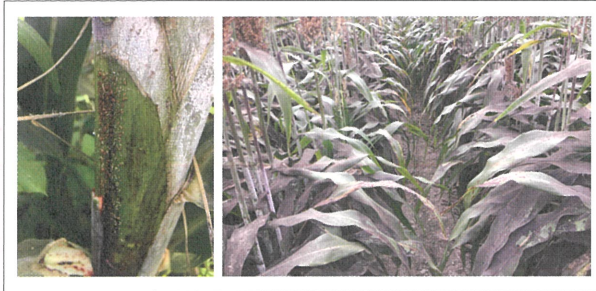
圖3. 高粱葉片上蚜蟲(左)密度高時,分泌的蜜露會引發嚴重煤煙病(右)。