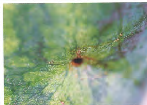
▲ 授粉後畸形果、裂果、病蟲果、重複果等均應及時拔除