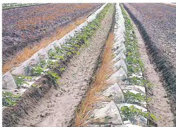
▲西瓜田作小畦、施基肥、鋪設塑膠布打洞後即可定植