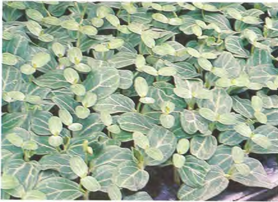
▲ 7 西瓜幼苗初步成活