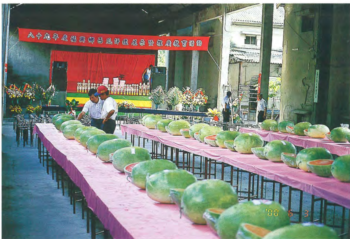
▲常舉辦西瓜品質競賽，以提高西瓜栽培技術