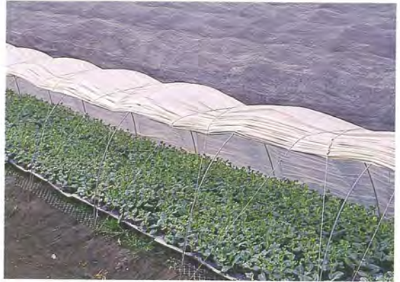
▲ 6 於遮蔭網下培育 7 天左右健化