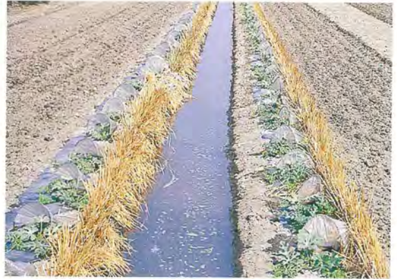
▲定植後需經常補充水分

(3)中央畦式：畦幅 2~2.1 公尺，株距 2~2.1 公尺，西瓜栽植於畦中央，植株向四方伸長。目前中央畦式之栽培為最少人利用，主要係因初期灌水、追肥噴藥不便及不利採收等缺點。