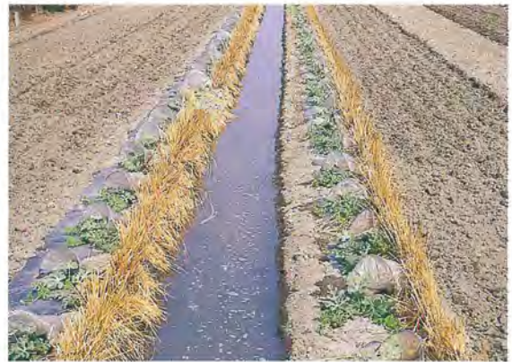
▲ 有充份的灌溉和光照，西瓜才能發育良好