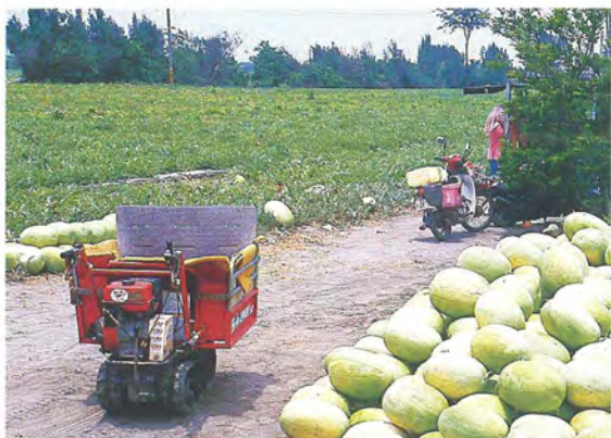
▲以鋁帶式搬運車，協助採收，可節省人力