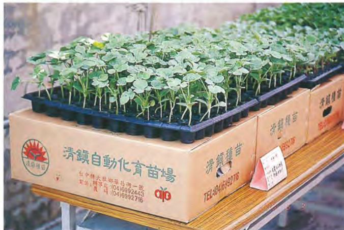
▲台灣地區目前大部份西瓜苗都向專業之育苗場購置