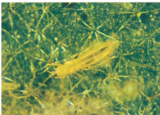
▲南黃薊馬成蟲