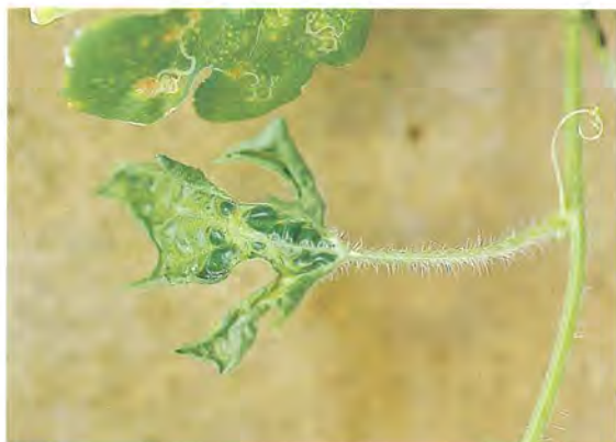
▲西瓜感染 ZYMV 病毒葉片病徵

防治法：由於瓜類病毒可經由汁液、蚜蟲或薊馬、種子、甚至污染的土壤等方式傳播，而本省田間周年均有瓜類生長，媒介昆蟲在瓜園又普遍存在，因此一旦瓜類受病毒感染，則很快便會藉由媒介昆蟲或機械接觸而