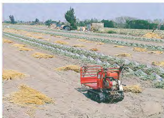
▲以鋁帶式搬運車搬運稻草