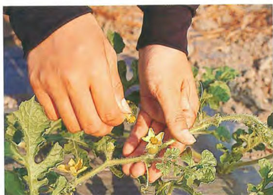
▲ 西瓜為典型半日花，多由蜜蜂授粉，不足時需假以人工輔助授粉以增加結果率