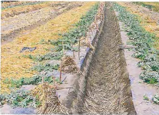
▲三月間寒流終了，掀除防護罩，作大畦才算完成定植作業此雙併條式栽培為最普遍使用之栽培方式

(3)中央畦式：畦幅 2~2.1 公尺，株距 2~2.1 公尺，西瓜栽植於畦中央，植株向四方伸長。目前中央畦式之栽培為最少人利用，主要係因初期灌水、追肥噴藥不便及不利採收等缺點。