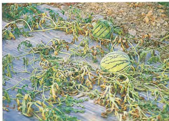
▲西瓜蔓割病植株枯死