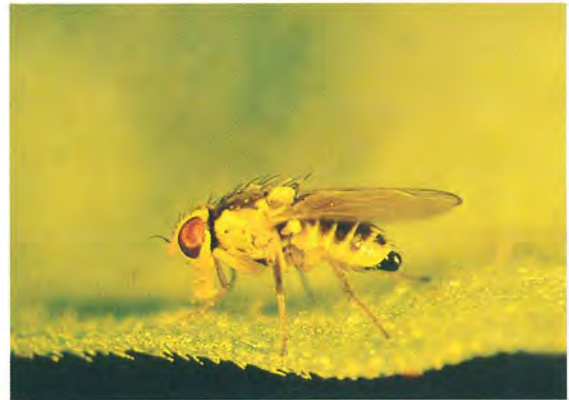
▲蔬菜斑潛蠅成蟲