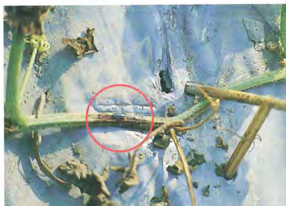
▲西瓜蔓割病莖生紅色汁液