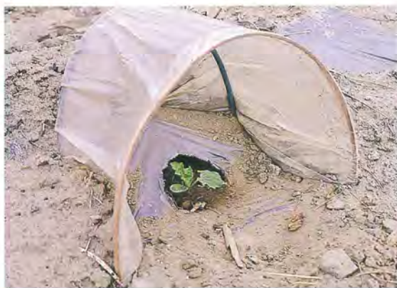
▲西瓜幼苗於早春定植時，插塑膠防風罩，以防止寒流侵襲