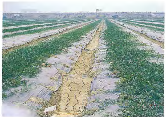
▲4-6 月定植之西瓜，要作較大排水溝，以排除多餘之雨水