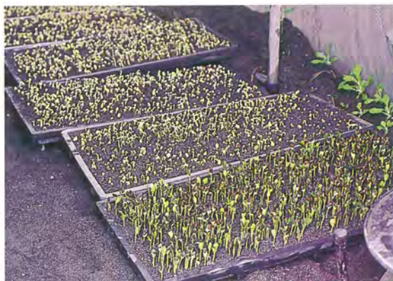
▲ 1 西瓜催芽