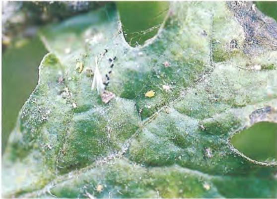
▲紅蜘蛛、蚜蟲等多由前期作殘延而來為害西瓜