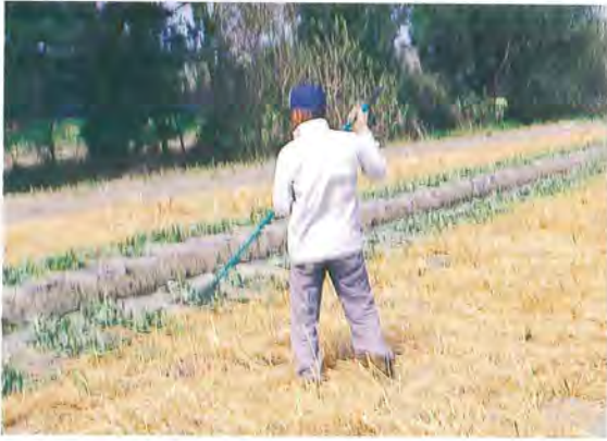
▲用人工插草，供西瓜攀爬，固定枝蔓