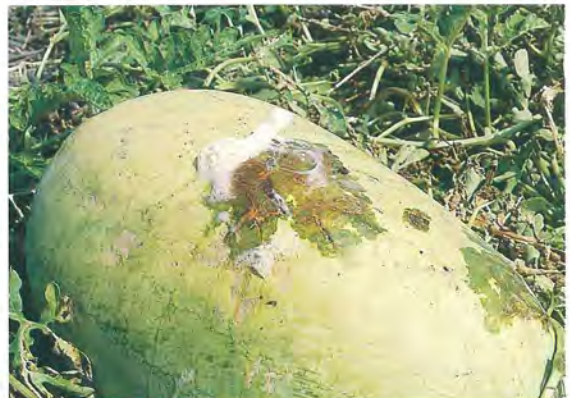
▲ 西瓜細菌性果斑病果實