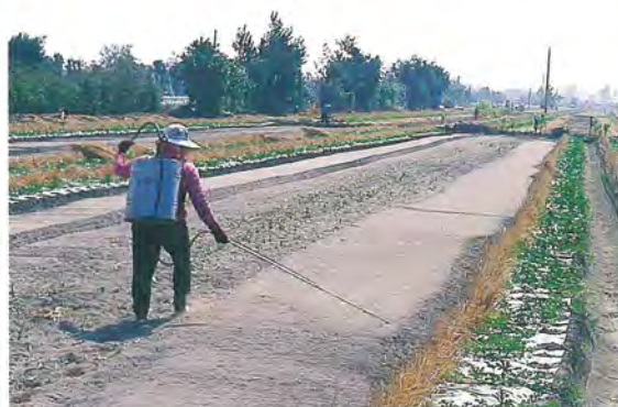
▲噴殺草劑以防雜草叢生