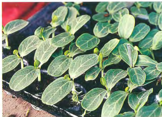
▲ 4 嫁接初步完成