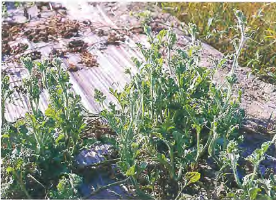
▲西瓜最忌連作，植株易遭受殘留各種病菌之為害