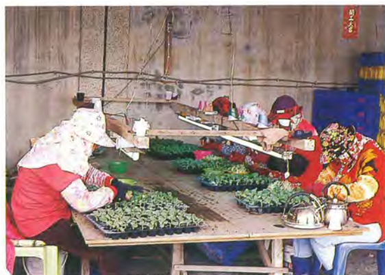
▲ 3 西瓜苗斜切嫁接於南瓜或扁蒲枯木上