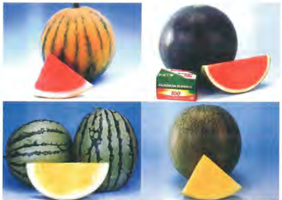
▲無籽西瓜為未來西瓜之新主張（左上：小冠、左下：鳳英、右上：小妃、右下：愛玲） 〈台灣農友種苗公司〉

早熟，地下病蟲害較少適合西瓜栽培，但保水、保肥力較差。中度黏重土壤，若注意排水、深耕、施肥量，也可獲得豐產之西瓜，惟需預防枝葉過度繁茂、延遲採收等缺點。但過分黏重土壤或高地下水位田區，均不適宜種植西瓜，種植環境同時應注意背風、向陽、暖地為佳、土壤之酸度 pH 值在 5.5~6.5 範圍較佳。西瓜最忌連作，尤其前期作忌避葫蘆科瓜類、蔬菜等作物，連作西瓜，植株易遭受殘留各種病菌之為害。以河川地、新闢地、水田輪作地栽植較易成功。