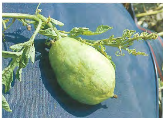
▲感染 WSMV 銀斑病毒植株及果實病徵