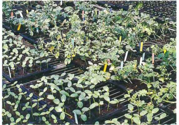
▲近年來西瓜育苗技術發達，多以穴盤育苗，可提早西瓜採收時間