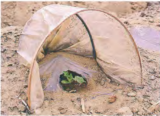
▲ 幼苗期低於 15 °C 時，幼苗產生黃化、矮化、停止生長等現象故以塑膠網防止寒流侵襲

西瓜為短日照作物，日照最低需 10~12 小時，好晴天、高溫、強日照。光飽和點在 8 萬 lux，光弱效能低，光度及日照時數長短關係著西瓜植株壯碩、產量與品質。幼苗期日照不足造成徒長，苗株瘦弱，易倒伏，罹白粉病、立枯病，死亡率高。強日照植株矮化才可育成壯碩之幼苗，生長期日照不足西瓜蔓及葉片脆弱，易受風雨損傷，及罹病蟲害，如炭疽病、白粉病及蔓割病等，授粉期更需光照，否則影響雌花開花，授粉和結果，影響品質甚巨。