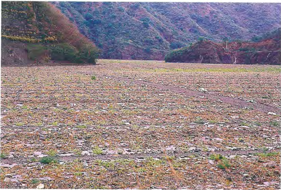
▲恆春枋山、楓港溪每年九至十月底開始定植西瓜，為台灣栽培西瓜的源頭

西瓜俗稱水瓜、寒瓜、夏瓜、青登瓜 (5) ，屬於葫蘆科 (Cucurbitaceae)，西瓜屬、西瓜種，在西瓜屬中有五個種，其中四個種 2n : 22 ，一個種 2n : 24 ，只有 Citrullus lanuatus (Thunb) Mansfeld ( 2n : 22 )，用作栽培 (10) 。西瓜英名為 Watermelon，原產非洲中部撒哈拉沙漠和周圍薩班那的熱帶高草原地區，5000~6000年前傳入古埃及，公元前四世紀由歐洲傳入印度，又傳到東南亞、西亞，公元前五世紀傳到希臘。公元六世紀時西瓜由伊朗、西域經“絲綢之路”傳入新疆，而國內最早有西瓜記載為宋朝，歐陽修新五代史中所撰載（西元