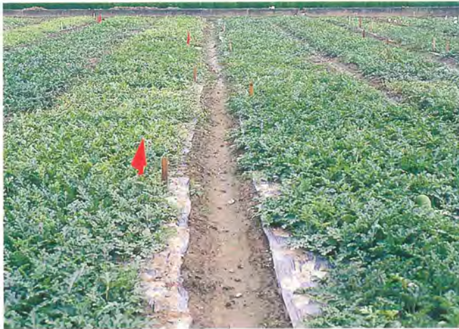
▲西瓜定植後 45 天，開始開花瓜田間一片綠意盎然