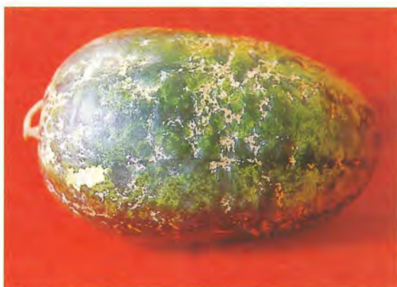
▲複合感染 CABYV、WSMV 及 ZYMV 之西瓜果實