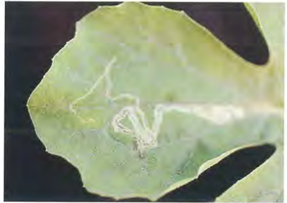
▲ 潛葉蠅為害西瓜葉片