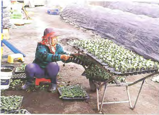
▲ 5 嫁接完成運至遮蔭網