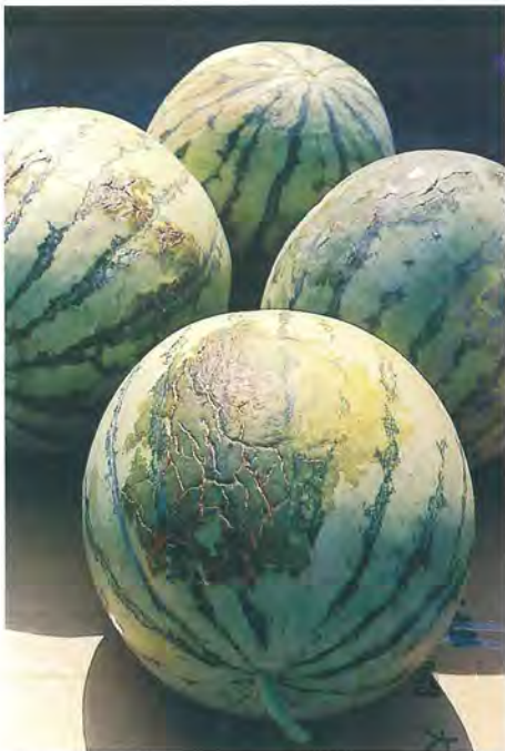
▲ 西瓜果斑病前期果實

病徵：在果皮上首先出現水浸狀小斑點，隨後擴大成爲不規則的大型橄欖色水浸狀斑塊，俗稱「黑面仔」，得病初、中期病變都只侷限在果皮，果肉組織仍然正常，病菌可單獨或隨同腐生菌蔓延到果肉，使果肉變成水浸狀，罹病果皮後期經常會龜裂，並因雜菌感染而在內部腐爛發酵。有些西瓜品種果實受感染後，在果皮僅出現龜裂的小褐斑，並沒有明顯得橄欖色水浸狀斑塊，但病菌已侵入果肉組織，造成嚴重之水浸狀病徵。病菌也會感染西瓜的子葉，是果實感染的重要來源。本病菌附著在種子表面，也侵入種子內部組織，帶菌種子成爲主要的初次感染源，種子發芽後病菌感染幼苗的子葉造成褐色壞疽病斑，也感染真葉但形成不明顯的褐色小病斑，罹病苗移入本田後，藉雨水或灌溉水而散播感染，病菌可經由傷口或氣孔感染果實，幼果受感染後病斑不明顯，但到將成熟前病斑則迅速擴大，病菌若直接感染後