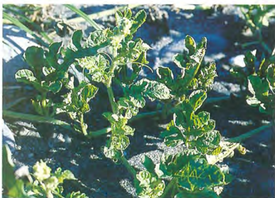
▲西瓜田間感染 PRV-W 之植株病徵