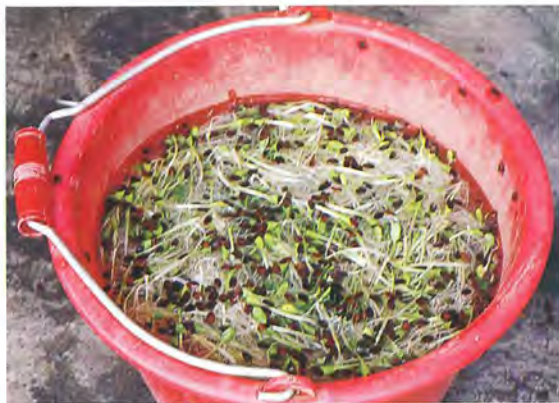
▲ 2 洗滌幼苗