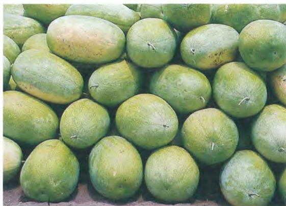
▲西瓜於9分熟時採收，置陰涼通風處儲放，因屬非更年性果實不需後熟就可食用