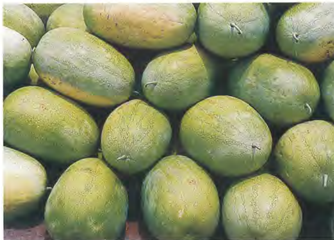
▲早春西瓜多用嫁接苗生產西瓜品質穩定，售價較高

947~953 年) (15) 。台灣的西瓜早年由大陸引進，1917 年以後始有記載，1944 年記載台灣栽培品種共有大陸及日本引進 11 個品種，1956 年農試所鳳山分所開始進行品種改良研究，1968 年農友種苗公司致力於西瓜育種開發。陸續育成優良品種推廣，由固定品種推展到一代雜交品種時代，使台灣西瓜產業聞名於世。