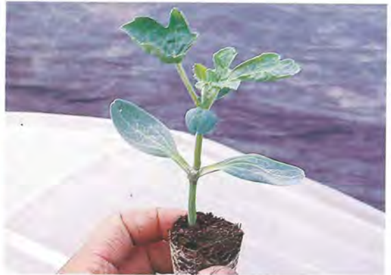
▲ 8 西瓜苗嫁接後 14-20 天成活即可送至田間定植