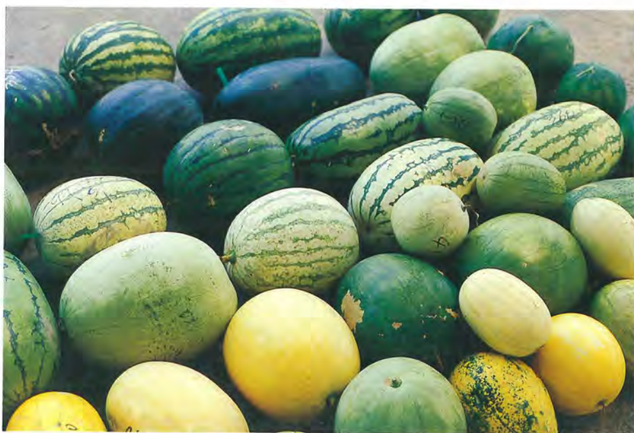
▲西瓜果皮有米、黃、淡青綠、深綠、黑綠等顏色及各種條紋，種類頗多

西瓜蔓可達 3~4 公尺，分枝性很強，根爲主根系，呈圓錐形，由主根、多次側根和根毛組成。莖部帶軟或硬的茸毛，卷鬚分 2~5 叉，葉爲單葉，掌形羽狀深裂，也有全緣葉，葉上密生茸毛。西瓜爲雌雄異花同株，通常爲單性花，但也有部份品種爲兩性雌雄異花 (5) ，花冠黃色五裂，雄花花冠較雌花稍大，雌花子房下位，雌花柱頭及雄花花藥都買有蜜腺，能引誘昆蟲傳粉，果實由子房發育而成，由果皮、胎座（瓤肉）及種子三部組成。種子扁卵圓或圓形，每果種子數約 400~1000 粒 (5) 。果型上又可區分爲圓球、高圓、橢圓、長條型等。瓤色有紅、桃紅、黃、橙黃和白色等顏色 (2) ，果皮色有米、黃、淡青、綠、深綠、黑綠等顏色，果皮條紋可分線條、細紋、無紋、虎斑等，種類頗多。