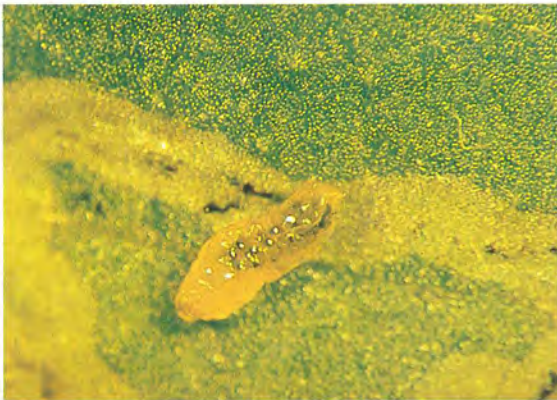
▲蔬菜斑潛蠅幼蟲