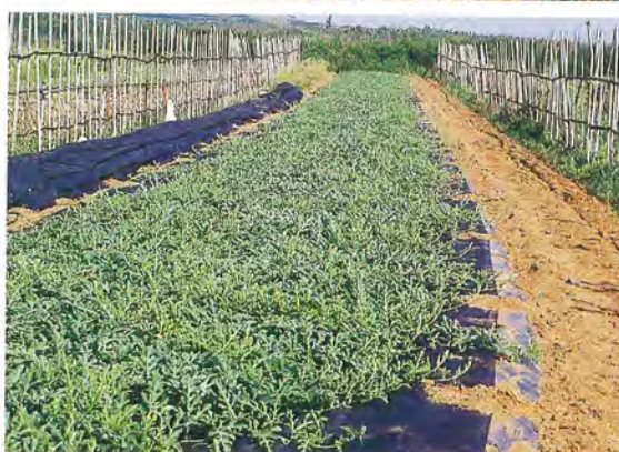
▲ 灌水、除草、施肥、整蔓及病蟲害控制為西瓜田間管理不可或缺之步驟