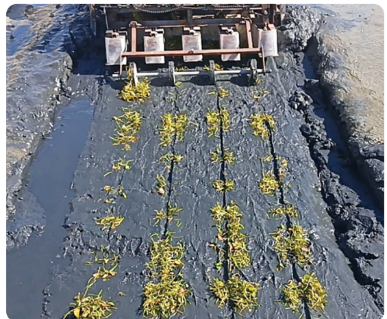
圖8. 野蓮田間種植測試