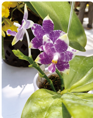
圖6. 藍紫色蝴蝶蘭雜交後代，常見花徑略小，花朵數少等問題。