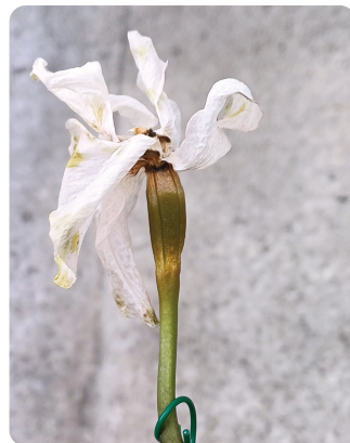
圖7. 藍紫色蝴蝶蘭與大花雜交，果莢發育容易失敗。