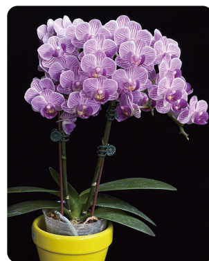
圖1. 藍紫色蝴蝶蘭薇薇安‘紫皇后’已少量在市場流通。

蝴蝶蘭 ( Phalaenopsis spp.; Phal. ) 具有花期長、種類多樣、能溫控調節開花特性，一年四季皆可培育開花株，臺灣蝴蝶蘭每年出口額高達45億元，堪稱為蘭花界「臺積電」，臺灣擁有蝴蝶蘭完整的生產供應鏈，客製化及品種多樣是其中不可或缺的關鍵，若需要在市場上具有更強的競爭力，且不輕易被取代，就需要不斷在形態上求新求變，其中粉色與白色為蝴蝶蘭最常見的花色，而夢幻且稀有的藍紫色品系卻是育種者趨之若鶩且極力想突破的目標(圖1)。有鑑於藍紫色蝴蝶於消費市場上的潛力，上一期我們介紹藍紫色特殊個體及藍紫色蝴蝶蘭育種概況，本期將延續探討藍紫色蝴蝶蘭生成原因和育種瓶頸，期望能促使蝴蝶蘭新品種的育成，以增加國際市場的競爭力與多樣性。