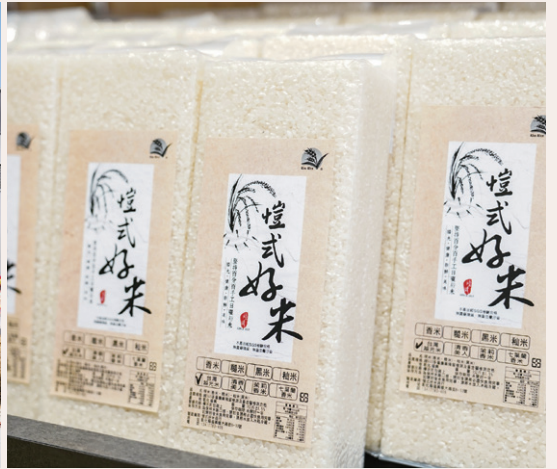
愷式好米有機碾米廠於 113 年開幕，並設有小農直販所展售相關產品