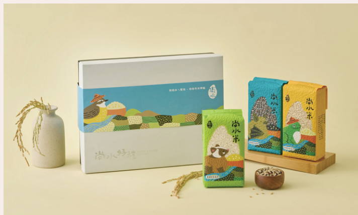
溪州尚水友善耕作田區環境自然，提供生物喘息空間，米禮盒的包裝將生態元素融入