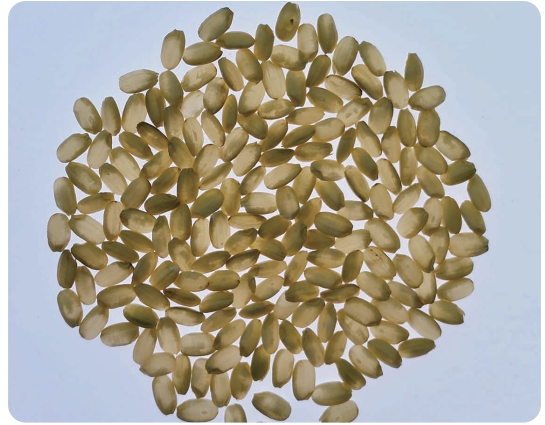
圖2. 高溫環境下糙米發生白垩質現象 (光板下呈現不透明區域)

尚未受到明顯波及，其餘地區的穀粒充實期已明顯高於臨界值 26^{\circ}\text{C} ；二期作穀粒充實期則呈現相反現象，僅高屏地區在高溫逆境(圖3)，但因高屏地區二期作大多為休耕，對產業的衝擊不如其他地區一期稻作明顯。反觀未來全球溫度上升 1.5^{\circ}\text{C} 情境下，不僅增加高屏地區一期作穀粒充實期高於 26^{\circ}\text{C} 的風險，更使臺中以南及臺東的區域在10月份月均溫將高於 26^{\circ}\text{C} (圖4)，表示未來某些區域可能在二期稻作也須留意高溫帶來的衝擊。