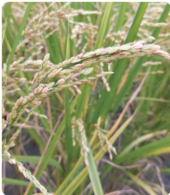
圖1. 高溫環境下穀粒不稔實現象 (稻殼仍保持綠色部分)

高溫逆境在水稻不同生育階段的影響情況不同，較常見的情況有：(1) 在秧苗期的熱障礙伴隨窒息病發生；(2) 花粉在高溫環境活性下降，產生不稔實粒（圖1）；(3) 在穀粒充實期導致粒重變輕及增加白垩質粒。其中白垩質粒是目前國內水稻產業受高溫逆境影響最有感的現象（圖2）。以目前國內主要