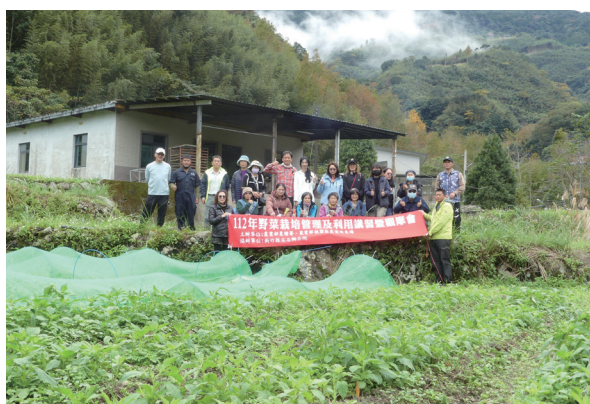
▲ 圖 6. 農友至尖石鄉煤源部落野菜示範田觀摩。