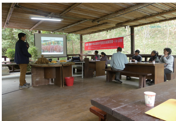
▲ 圖 7. 本場林禎祥副研究員 ( 左 1 ) 講授小米栽培技術。