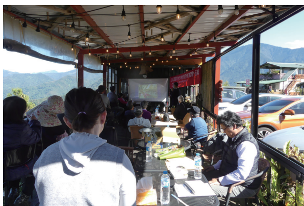
▲ 圖 5. 本場姚瑞禎助理研究員 ( 中站立 ) 講授甘藍病蟲害防治技術。

本場112年於原鄉地區共辦理8場講習會，4場田間指導，1場田間觀摩會，講師共計18人次，總計輔導農友225人次。期望能加強原鄉農友對特色作物栽培技術，並能實地解決農友栽培上遇到的問題，進而增加農友的經濟收益。