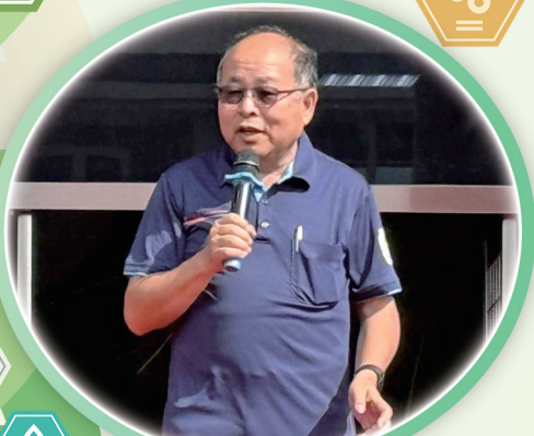
本場羅正宗場長致詞歡迎來賓