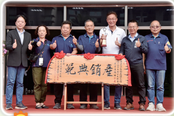
114年全國十大績優農業產銷班—高雄市美濃區果樹產銷班第16班