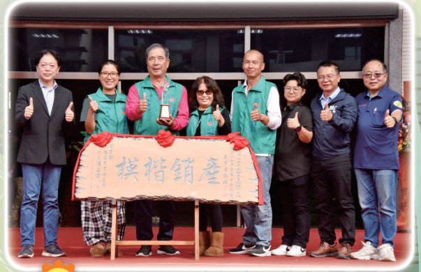
114年全國十大績優農業產銷班—高雄市永安區石斑魚產銷班第8班

活動中並舉行頒獎典禮，表揚2026年蓮霧與棗果園評鑑競賽得獎農友、114年全國十大績優農業產銷班及優良農業產銷班、第四屆全國十大綠色照顧、114年特色家政班、臺灣稻米達人等獎項，以及績優輔導單位，肯定農業從業人員與相關單位的用心與付出。