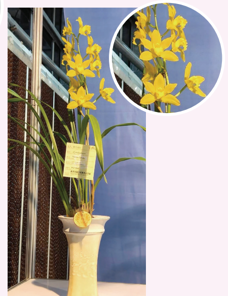
▲ 蕙蘭 Yellow Candy 'PC1354' 獲銅牌