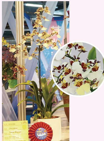
▲ Oncidesa Tdares Magician 'Taichung No.5 White Lady' (台中 5 號 - 白色佳人) 獲第二獎