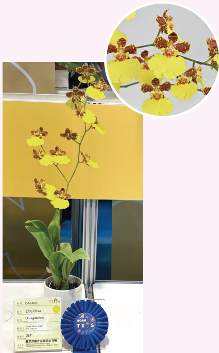
▲ Oncidesa sp. 獲第一獎

本場投注蘭花育種多年，選育高品質多花色之盆切花品種並輔導文心蘭產業發展，期盼臺灣蘭花能享譽世界各地，共創永續未來。