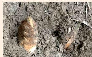
▲圖 4.冬天吃筍就要找孟宗竹。