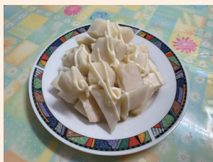
▲圖 1.涼筍沙拉是夏季熱門涼菜。

說到竹筍，許多人都會聯想到夏季的「涼筍沙拉」，但你知道冬天也有竹筍嗎？相傳三國時代一個老婦人非常喜愛吃竹筍，某一年冬天，突然很想吃竹筍羹。孝順的兒子孟宗為了滿足母親的心願，便跑到竹林裡去尋找，但找了很久都沒有找到，心急如焚的孟宗便抱著竹林大哭，沒想到地上冒出幾支竹筍。先人認為是孟宗的孝行感動天地，所以老天爺才會讓竹筍於寒冷的冬天出土，這個孝行收錄於《二十四孝》中「孟宗哭竹生筍」，作為後人孝道之表率。後人更以「孟宗」之名命名該筍。