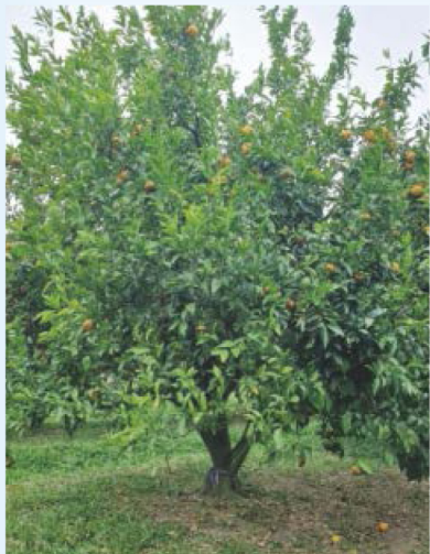
黃金茂谷柑植株，樹勢略強，管理上須特別注意修剪及肥培作業，避免發生大小年。

黃金茂谷柑，別名沃柑於2003年由嘉義大學園藝系呂明雄名譽教授自泰國引進臺灣，目前臺灣栽種面積不多，多集中於南投、苗栗卓蘭、宜蘭頭城一帶，黃金茂谷柑以金黃亮麗的外觀及濃厚風味，成為具代表性的新興高品質柑橘品種。