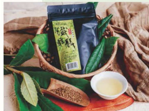
枇杷葉茶風味溫潤回甘且不含咖啡因

https://jinmingnaturalfarm.easy.co/ ）參觀選購。