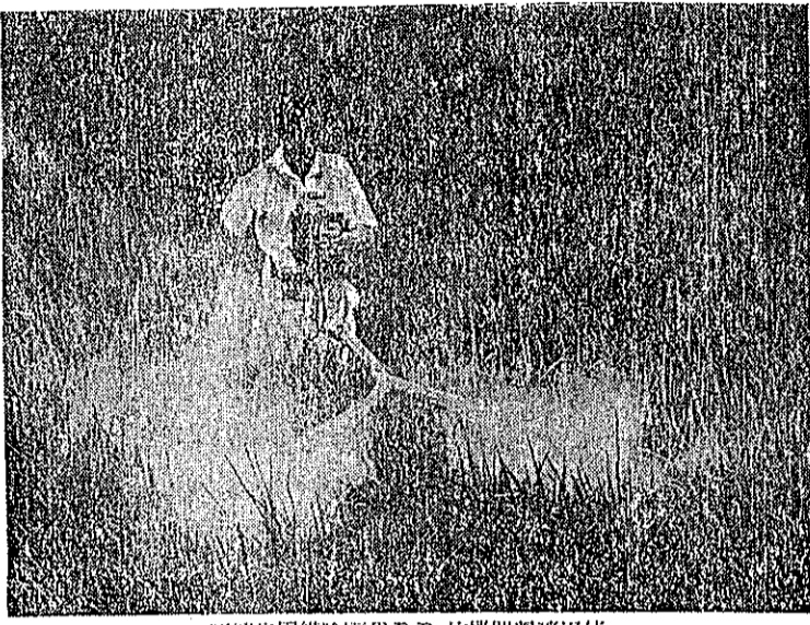
形南蟲甲鐵線真T.D.D. 佈撒器粉噴用使

同時再用 DDT 粉撒在真蕪上，如此可以撲滅無數的蟲子，那第二期作就不會再發生了。 撒佈 DDT 粉的方法，如果有撒粉器最好，否則可以用 DDT 粉裝在布袋或麻袋，用手輕輕拍袋使粉撒在雜草上，也可得到效果。 農友們：你們應該共同合作，個人的田都要防治才可。如果不熱心防治，那就要害到別人的。如果不徹底防除，恐留些蟲種，以後還會繁殖擴大的呢！大家協力起來防治你們最害怕的黑龜蟲吧！那你們的水稻才可保護，才可增加收成，你們的生活才可改善。