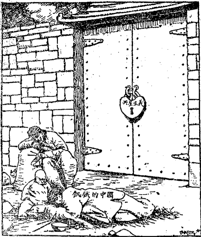
大門口已經上鎖了

自從第二次世界大戰結束到今日已有六年，但是約有一百萬的俘虜尚被拘留在蘇聯及其他共產黨國家內未送回本國。德國、義大利和日本曾向蘇聯抗議要求說明這些戰俘的下落，蘇聯駐日代表團說：「現在仍舊拘留在蘇聯境內的日本俘虜，總計僅為五、六名而已。」 日本外務省曾為戰俘事以白皮書發表說：蘇聯及朱毛匪區內，尚有三十萬零五百八十名的日本戰俘及平民未被遣送返日，相信其中 只有七萬七千餘人尚生存，而廿三萬四千一百餘人則已死在蘇聯及中國東北之集中營裡，因此日本政府決定在簽訂對日和約以前與有關國家解決這件事。 日前在東京有七十八名日人（其中婦女三十一人）用絕食來抗議日本政府忽視這件問題。他們請求日本政府將此項遣送俘虜問題列在和約之中。但政府方面表示：因為當年日本是無條件投降，所以將此事列入和約條款內不是一件容易的事