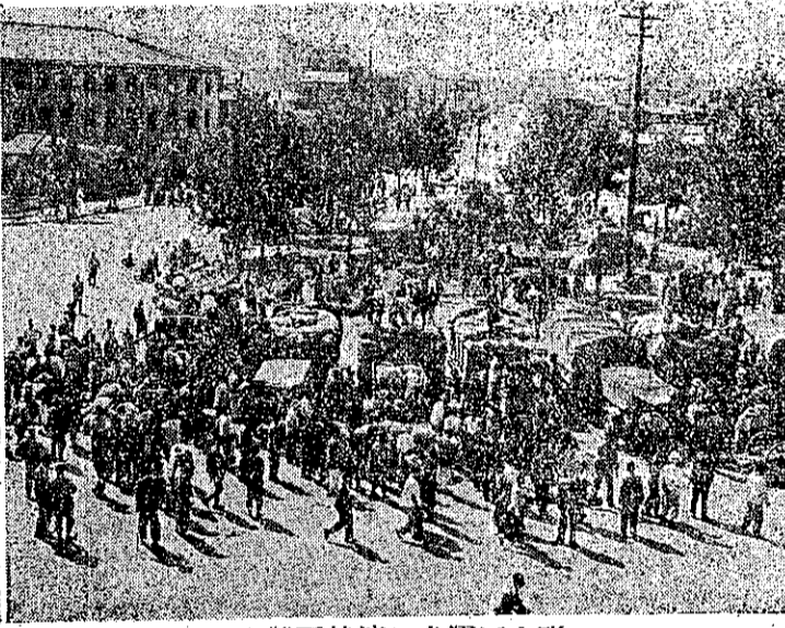
聯合國運米救濟韓國難民

在韓國有一位美國兵，以美金六十一元買一件用四十八張豹皮製成的地毯，裝在一個破行李袋，再用了四十元（美金）航空郵費，將其送回美國給他的雙親做為紀念品。但却不知這件地毯，原來就是韓國有歷史性的國寶，時價達十萬美金（約合新台幣一百五十餘萬元）。韓國政府現正在設法收回這件國寶。