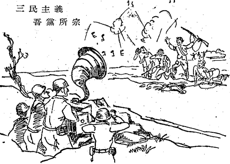
三民主義 吾黨所宗

聯合國軍隊最近在韓國前線放逐我國的國歌，每次放逐完的時候，即有數十名的匪軍越過火線來向聯軍投降。 講起這種攻心戰術，是因為聯軍營內現在有大批的共匪俘虜，聯軍對他們非常優待，每日給他們許多營養的食品，俘虜也可以運動也有娛樂的時間，電影或是放送唱片都有，每當匪俘們聽到我國國歌的時候，都一致起立肅然致敬，也有多數匪俘痛哭流涕。聯軍總部便想在前線放逐自由中國的國歌，能使匪軍的士氣動搖，結果非常成功。