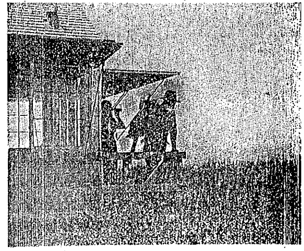
火救助出時臨臨，察視在正員視監災火林森的國美降月飛飛學即，近接法無部軍火或引等用使假區地災火。火救去下傘落

美國農業部官員林克雷斯，即將在美國農業部的協助下，到美國西北部參觀森林火災撲滅法。並要到其他各地去參觀國立林場及公園的管理情形及土壤保存與水利工程。