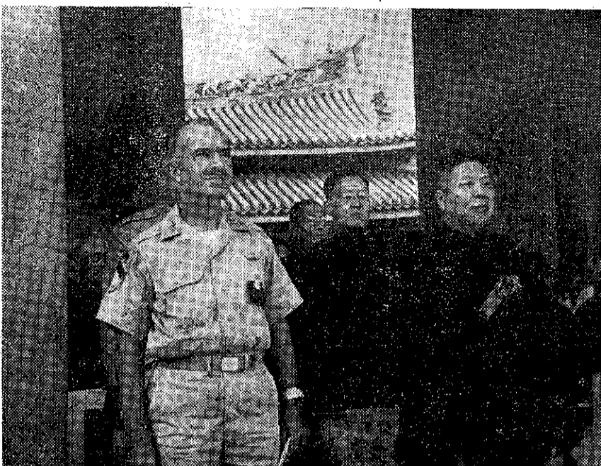
(左)長團斯蔡(中)成德孔官祀奉(右)席主吳的典祭加參分