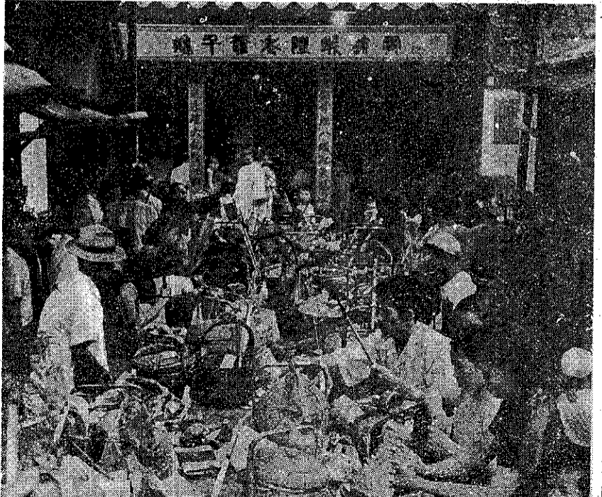
。面方設建在用，錢金的拜拜將該應們我

目前省內香茅油產地售價是每臺斤新臺幣十六元左右。農復會與省農林廳合作，對豬瘟病毒丹毒的防治，以及飼養方法的改進和宣傳，曾盡了極大的努力。因此，本省豬隻的產量已由去年春季的九十萬隻增爲一百五十萬隻。又飼豬用的豆餅，大多是由美國經合會中國分署供給的，該署自去年九月起經由省農會配發給農民飼豬用的豆餅，多達八十五萬二千餘片，對本省豬隻的增產貢獻很大。又臺南縣北門鄉農會已經訂了一種「北門鄉農會養豬肥育比賽會實施辦法」，將自九月廿二日起兩個月間舉行比賽，由該會主辦，鄉公所爲北門鄉農會會員。