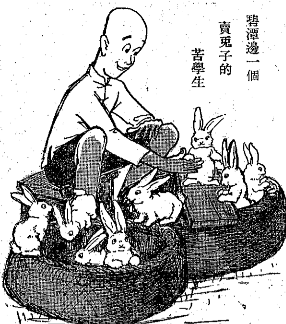
碧潭邊一個賣兔子的苦學生

他是一個初中二年級的學生，在他那農村的家庭中，兄弟却很多，自然，他的學費零用，就是很大的支出，但是求學心切，就想了一點生產的方法，餵養兔子來增加他的收入。他利用假日在公衆的地方售賣他的兔子來補助不足的用度。他常利用課餘的時間去採摘青草，菜葉等兔子的食物，還