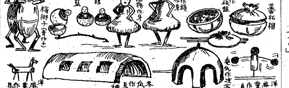
蔬菜玩具 (四三第) 編子菓

在這一箇皎潔的月夜，每家都磨利了他們的厨刀，當這些「鞭子」被邀請到庭裡賞月的時候，便不提防的被他們殺死，參加這一次行動的每一個