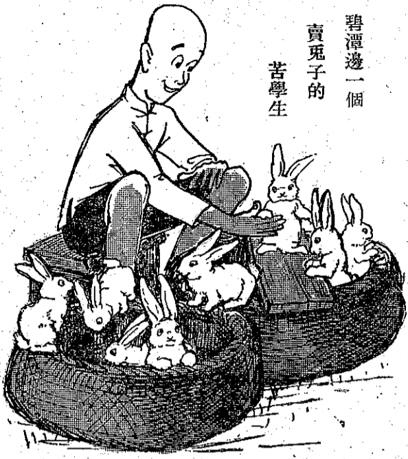
碧潭邊一個賣兔子的苦學生

他是一個初中二年級的學生，在他那農村的家庭中，兄弟却很多，自然，他的學費零用，就是很大的支出，但是求學心切，就想了一點生產的方法，餵養兔子來增加他的收入。他利用假日在公眾的地方售賣他的兔子來補助不足的用度。他常利用課餘的時間去採摘青草，菜葉等兔子的食物，還