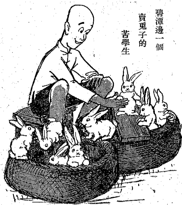
碧潭邊一個賣兔子的苦學生

他是一個初中二年級的學生，在他那農村的家庭中，兄弟却很多，自然，他的學費零用，就是很大的支出，但是求學心切，就想了一點生產的方法，餵養兔子來增加他的收入。他利用假日在公衆的地方售賣他的兔子來補助不足的用度。他常利用課餘的時間去採摘青草，菜葉等兔子的食物，還