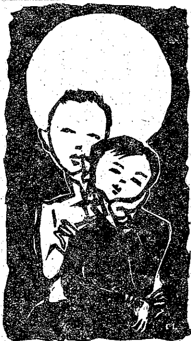
十五月娘 圓輪輪 照去溪邊 映羅藤 久久無看 娘仔面 見着一娘 重倍親