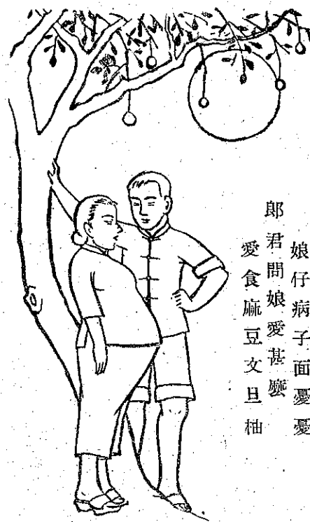
八月順來是中秋 娘仔病子面憂憂 郎君問娘愛甚麼 愛食麻豆文旦柚

△月亮也是蘇俄的好嗎？ 人類的始祖「亞當」與「夏娃」，據蘇俄的科學者說是蘇俄的公民（參閱本刊第一期漫畫篇） 又據共黨的指導員說，蘇俄是世界上農業最進步的國家，因為它的收穫，無論什麼東西，一年 有四次，收成（本刊第三期）。現在中秋到了，莫斯科的天文學家說：月亮也是蘇俄的好，騙人的本領也是蘇俄最高明！