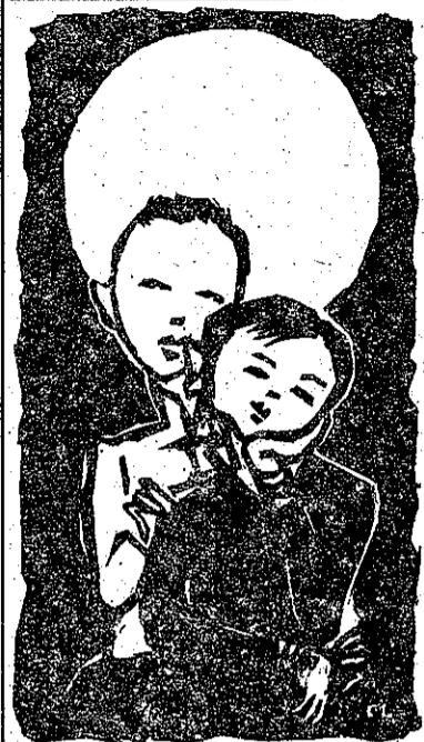
十五月娘 圓輪輪 照去溪邊 映羅藤 久久無看 娘仔面 見着一娘 重倍親