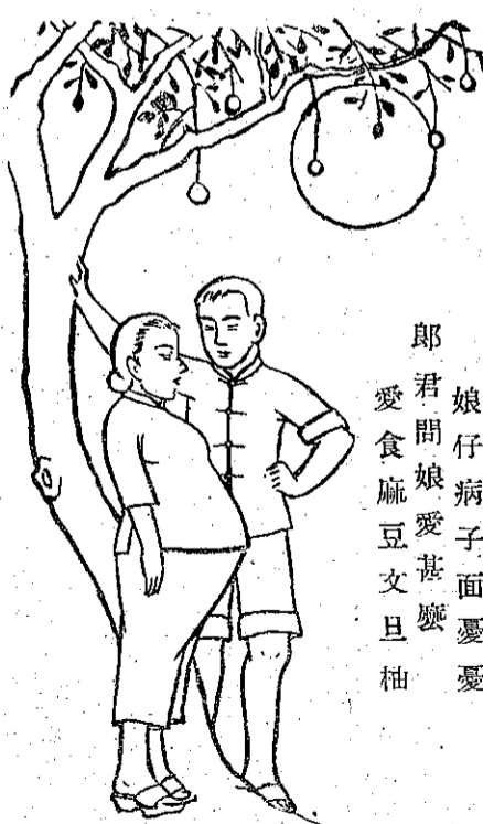
八月順來是中秋 娘仔病子面憂憂 郎君問娘愛甚麼 愛食麻豆文旦柚

△月亮也是蘇俄的好嗎？ 又據共黨的指導員說，蘇俄是世界上農業最進步的國家，因為它的收穫，無論什麼東西，一年有四次，收成(本刊第三期)。現在中秋到了，莫斯科的天文學家說：月亮也是蘇俄的好，騙人的本領也是蘇俄最高明！