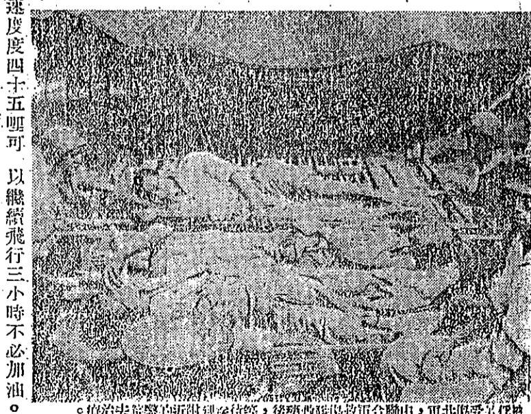
療治去醫的頭到到待等，後務醫醫局救軍合聯由，軍共受受俘俘

以外，飛機並可牧場，或除去森林及其他重要的工作。現在美國已經建造一種專門的飛機，用這種飛機，可以噴灑大量的殺蟲劑，以保護農作物。這種飛機，可以噴灑大量的殺蟲劑，以保護農作物。