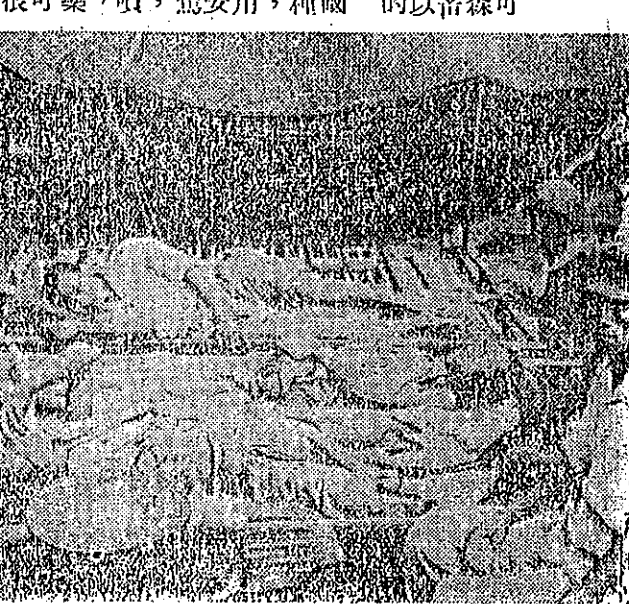
韓醫治共俘七萬人，後方設有很多醫院，專替共軍的俘虜醫治。

據最近從中港的難民說：今年四月到六月，廣西省發生極嚴重的飢荒，人民被迫拿樹皮草根來充飢，只有多少萬人，只有多少萬人，只有多少萬人。 據最近從中港的難民說：今年四月到六月，廣西省發生極嚴重的飢荒，人民被迫拿樹皮草根來充飢，只有多少萬人，只有多少萬人，只有多少萬人。