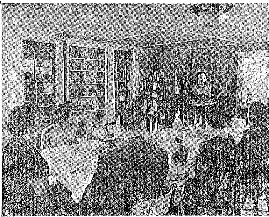
味滋雞火翅的傳祖受享備畢下坐上席筵祝慶在日節恩感在庭家國美個一

可愛的大地呀， 我們歡迎你， 歡迎你那些翠柏松， 歡迎你那些金色的田園， 歡迎你那些葡萄園， 歡迎你那些森林， 歡迎你那些草原， 歡迎你那些山嶺， 歡迎你那些溪流， 歡迎你那些花朵， 歡迎你那些果實， 歡迎你那些收穫， 歡迎你那些希望， 歡迎你那些未來。