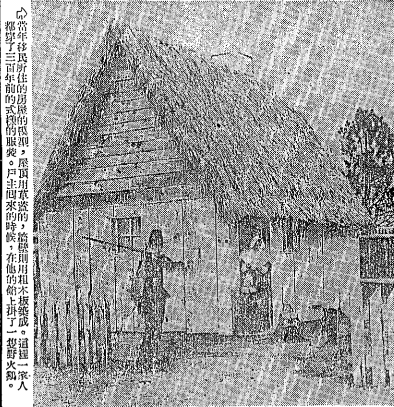
當年移民所住的房屋，屋頂用草蓋的，牆壁則用粗木板築成。這種一家人都穿了三百年前的衣服，戶主回來時，在船上的時候，這是一家人。

他們在海上漂流了兩個多月，食物和水都耗盡了。他們在海上漂流了兩個多月，食物和水都耗盡了。他們在海上漂流了兩個多月，食物和水都耗盡了。他們在海上漂流了兩個多月，食物和水都耗盡了。他們在海上漂流了兩個多月，食物和水都耗盡了。他們在海上漂流了兩個多月，食物和水都耗盡了。