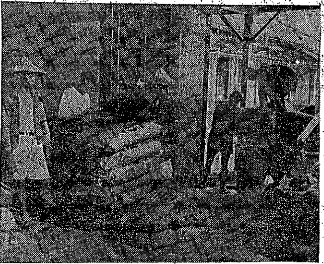
配分始開料肥作稻期一

今年第一期稻作肥料總數，爲十七萬公噸，已經在各各地先後開始分配中，預定於二月底以前，可全部分配完畢。 各地農民，能適時施用，用以增產食糧。尤其是鉀、磷、石灰、灰、石、化、肥、等，比較過去，已經提早運到，以便農民，可以用作基肥。本期水稻肥料，分期分批分配，這次第二批水稻肥料分配量，各地區每公頃一律分配：