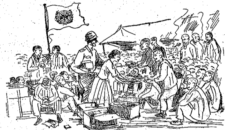
「去回意願不們我，好過待的軍聯」：說都俘虜軍共多很

在韓國的停戰談判中，聯軍代表曾向共方建議立即交換傷病的俘虜，但被共方拒絕了。據最近在日本和韓國旅行一個月後，牧師巴克說：若千韓國的共軍俘虜，都懇求不要把他們遣回北韓或中共區去。傷病的共軍俘虜，已經受到了像醫藥、士兵所享受的這些俘虜都得到足量的適口的食物和溫暖的衣服及適當的住所。這也許是他們前此一生中都沒有享受到的。又據美國紐約的一有名報紙「先鋒論壇」說：北韓的某地，中年的農民，多放棄了他們的土地，偷跑到聯軍防線，每週幾達一百人。這些農民，但他們都看清楚了共產黨不會留給他們過冬的