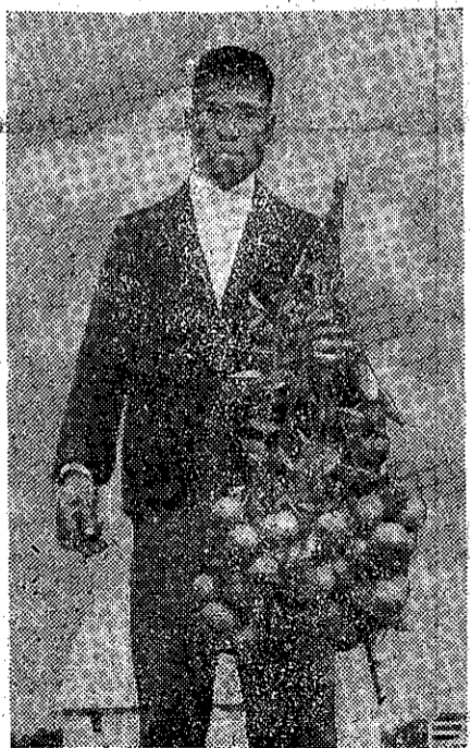
好也質品，多得結實果樹母的好。多也入收的農果以所

農復會協助調查甜橙母樹，為增加柑桔果農的收入起見，農復會現正在進行一項調查。該會正在全省各地協助柑桔果農調查母樹。調查母樹，是為了選出優良母樹，以便將來推廣繁殖。調查工作現正在全省五處進行中。因為將來繁殖的優良母樹，就是將來推廣繁殖的優良母樹。故希望果農對於母樹的調查工作，和將來購買母樹的接穗時，要多多合作。